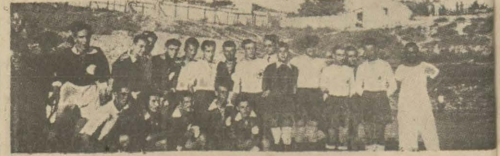
Bursalı ve Topkapılı futbolcular maçtan evvel...

Pazar günü Karagümrükteki futbol stadında oldukça ehemmiyetli müsabakalar yapılmış; Topkapı klübü tarafından bir maç yapmak üzere şehrimize davet edilen Bursa ikincisi Duraspor klübü misafiri bulduğu Topkapılılarla karşılaşmıştır.