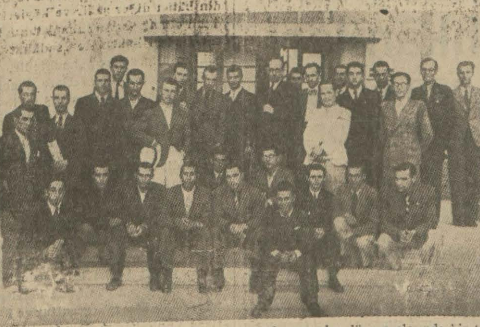
Pettevniyal lisesinden bu sene mezun olan gençler dün aralarında bir toplantı yapmışlar ve saat üçte öğretmenlerle bir çay ziyafeti vermişlerdir. Resimde mezun olan genç talebeler görülmüştür.