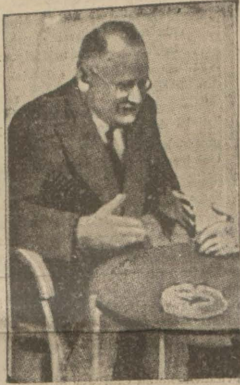
Sovyet Hariciye Komiseri Litvinov