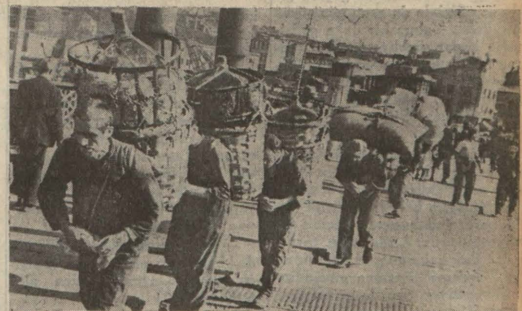
Karaköy köprüsü üzerinde son hamal kafilesi

Karar bu sabahtan itibaren tatbik ediliyor