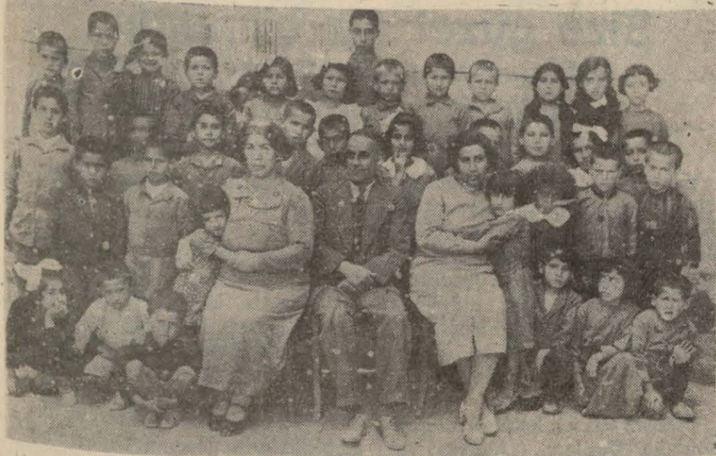
Gaziantep Istiklal İlk okulu talebesinden bir grup

Gaziantep, (Hususî) — Vilâyet dahilindeki ilk okullardan dört yüz mezun verilmiştir. Geçen seneden fazla olan bu miktar 937 38 ders