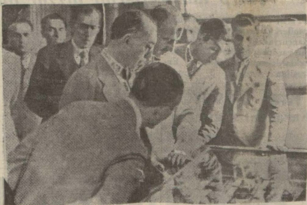
Hariciye vekilimiz İrandaki ziyaretleri esnasında Tahran daimî sergisinde

Bunun dokümanite izahının ya- nmasını Türk Dili Kurumu sayın bilimden ve dil tetkikatine meş- gul olan okuyucularımızdan rica ederiz.