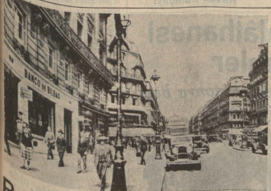
Tahrir edilmekle tehdit olunan Bilbao