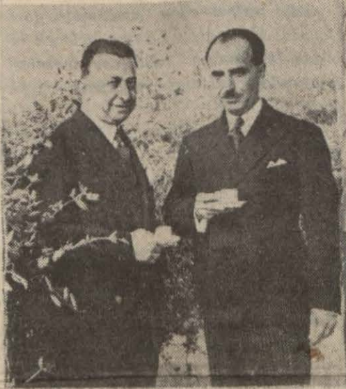
Irak Hariciye Veziri Dahiliye Vekili, mizle beraber

Dost memleket Veziri İstanbulda üç gün kaldıktan sonra Ankara yolu ile Iraka dönecek