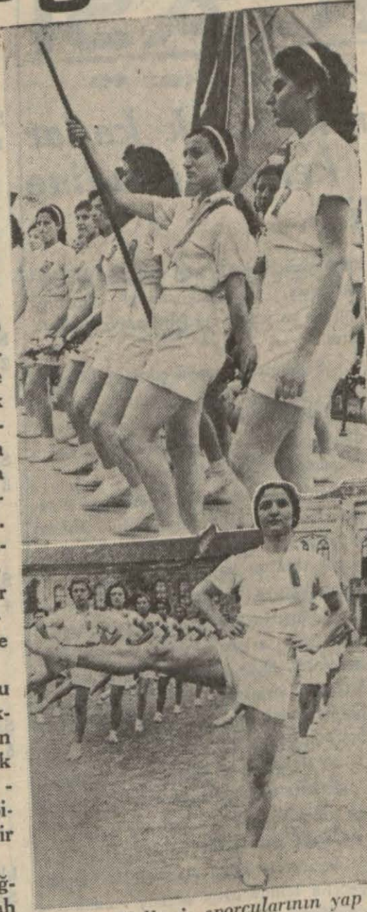
Beyoğlu Halkevi sporcularının yaptığı geçit resmi ve beden hareketleri.

Bugün Türkiyenin her tarafında milyonlarca Türk 19 Mayıs gününü kutlularken çocuklarının spor gösterilerini gözleri yaşararak, fakat