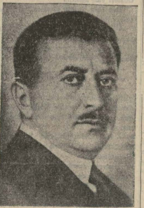
B. Şükrü Kaya

"1919 senesi mayısının 19 uncu gününü Samsuna çıktım. Vaziyet ve manzarayı umumiye, Osmanlı devletinin dahil bulunduğu grup, Hrabî Umumide mağlûp olmuş, Osmanlı ordusu her taraftan zedelenmiş, şeraiti ağır bir müta-rekename imzalamış, büyük harbin uzun seneleri zarfında millet yorgun ve fakir bir halde, millet ve memleketi Harbi Umumiye sevkedenler kendi hayatları endişesine düşerek memleketten firar etmişler. Saltanat ve hilâfet mevkiini işgal eden Vahdetin mütereddi şahsını ve yalnız tahtını temin edebileceğini tahayyül ettiği deni tedbirler araştırmakta. Damat Ferit paşanın riyasetindeki kabine âciz, haysiyetsiz, cebbin, yalnız padişahın iradesine tabî ve onunla beraber şahıslarını vikaye edebilecek herhangi bir vaziyete razı. Or-