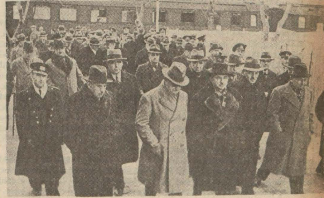
Başvekil İsmet İnönü şehrimizden Ankara'ya avdet ettiği zaman kendisini karşılayanlarla beraber