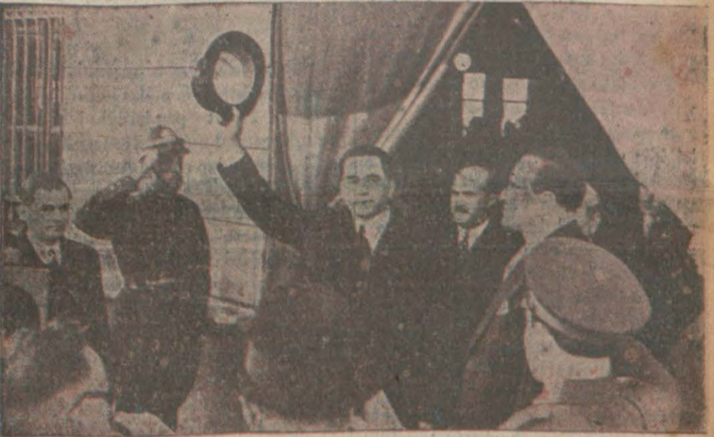
Kıymetli Başvekilin şehrimizde bıraktığı iki intiba