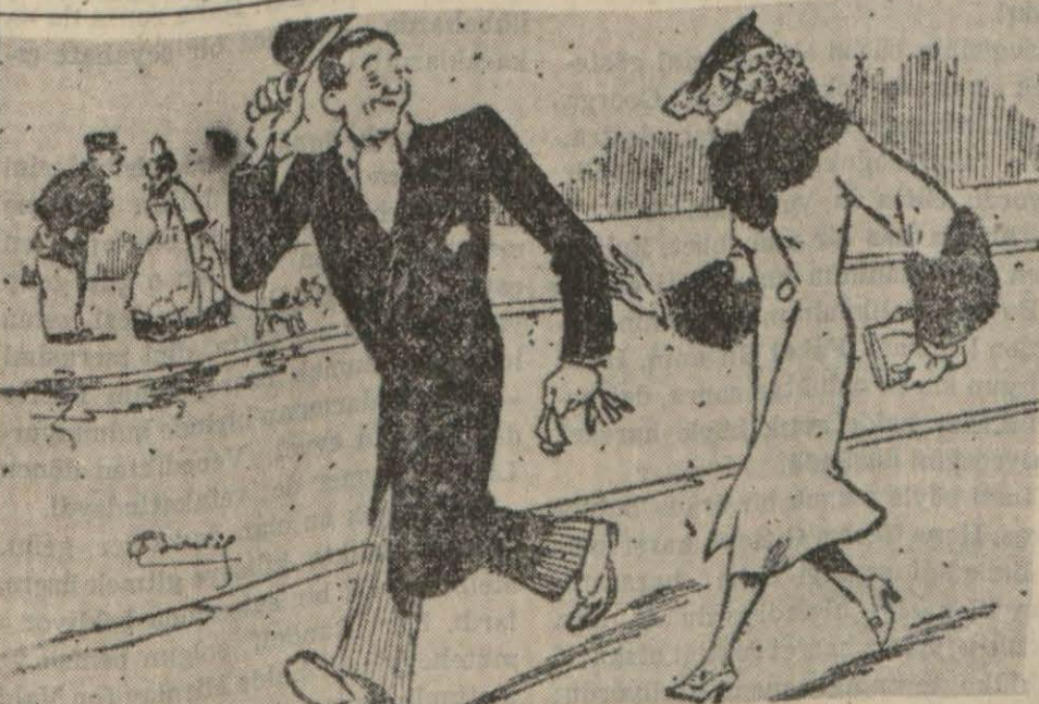
— Bonjur, Bayan. Köprüye gitmiyorsunuz, değil mi? — Hayır, efendim... — İstebet, Ben de köprüye gitmiyorum. O halde beraber gidebiliriz. ..