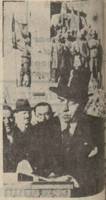
Muhterem Başvekil Âbidede

Şehirde cumhuriyet bayramı hazırlıkları bittiği gibi, şehirde elektrik