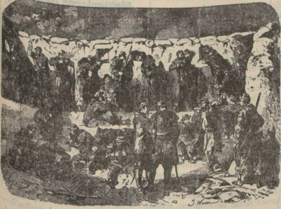
Mamelon istihkâmlarında Fransız neferleri..

Bir İngiliz neferi harp bitti diye gelirken üç Rusla karşılaştı ve