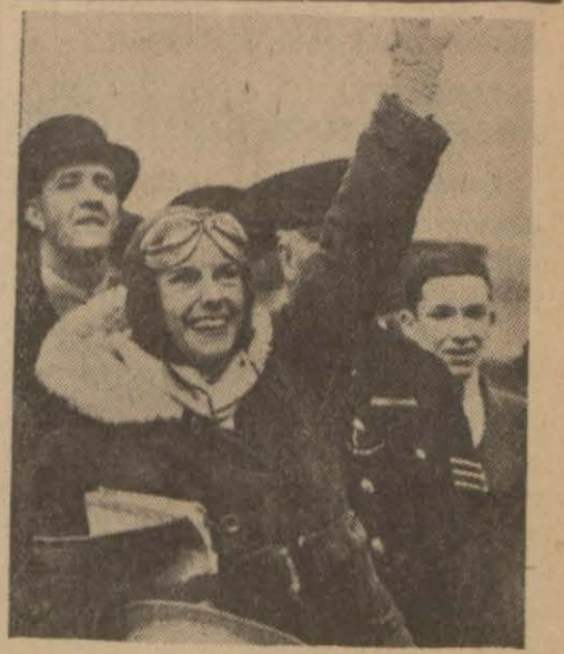
Mis Amy Mollison