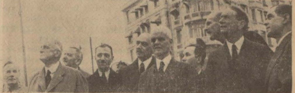
İngiliz heyeti çelenkleri götürürken ve âbide önünde