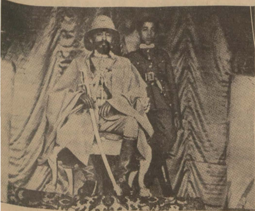
İmparator velihat ile beraber tahtında iken.

İtalyan hakimiyetinin tanınmasını istiyor