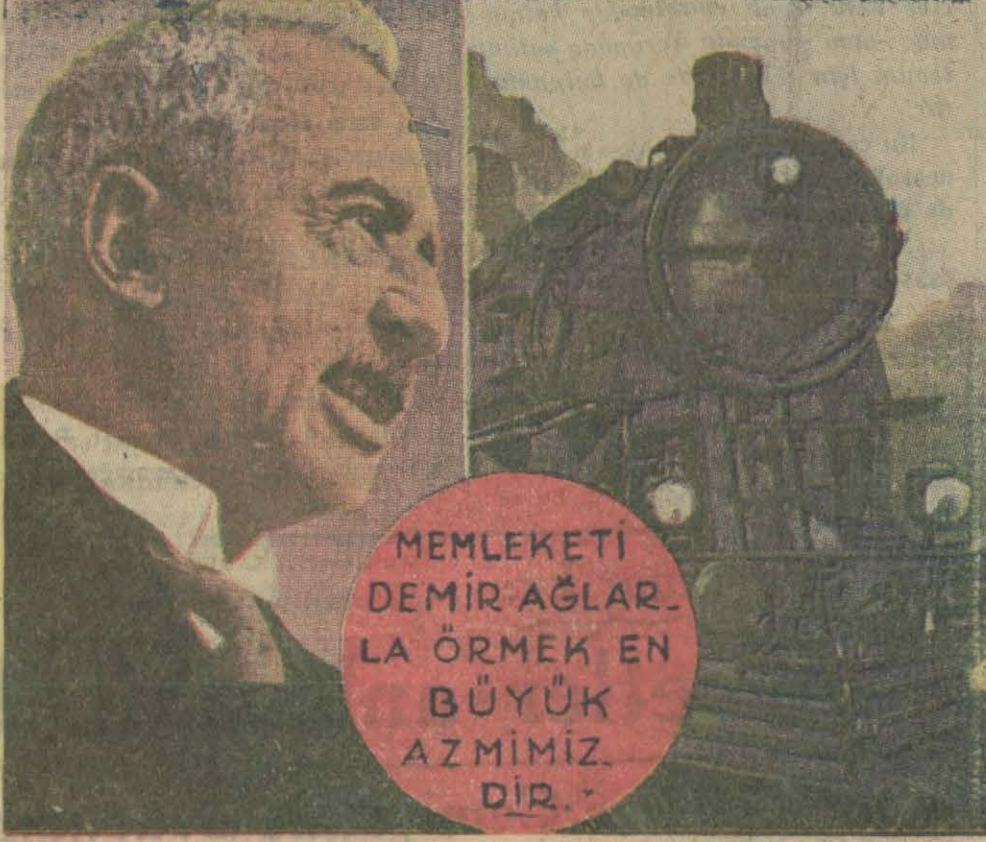
Afyon — Kocakuyu hattı bugün açılacaktır.