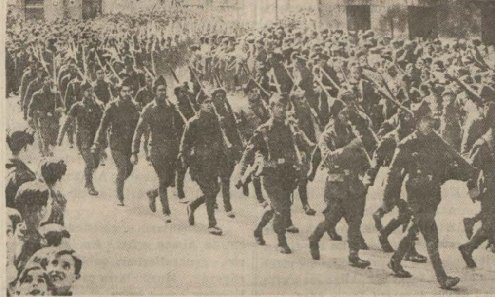
Nasyonalistler zaptettikleri bir şehre giriyorlar

Paris, 8 (A.A.) — Gazetelerin ekserisi Madridin bilkuvve zaptedilmiş olduğu müteakibinde serdetmekte ve bir Katalonya cumhuriyeti ilân edilip edilmeyeceğini sormaktadır.