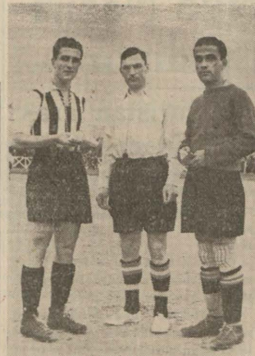
Besiktaş - Galatasaray kaptanları dünkü maçta hakem duran antrenör, ve maçtan bir görünüş