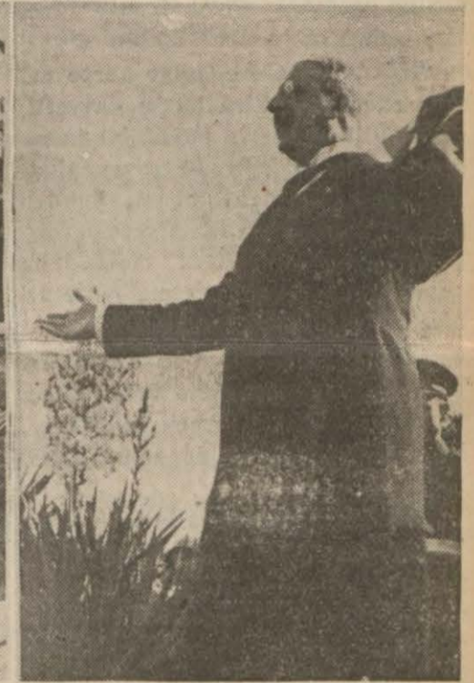
Ali Fuat nutuk söylüyorlar

Merasimde hükûmetimiz namına İstanbul kumandan vekili ve harp akademisi kumandanı General Ali Fuat, General Osman Tufan, İstanbul