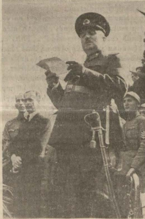
Alman sefiri ve Korgeneral

Umumi harpte Çanakkalede ölen 52 Alman askerinin kemikleri dün Tarabyadaki Alman sefarethanesi bahçesindeki mezarlığa gömüldü.