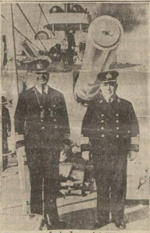
Filomuzun amiral gemisi "Yavuz", un kaptan ve çarçısı güvertede

Donanmamız yarın sabah Pire'de bulunacak