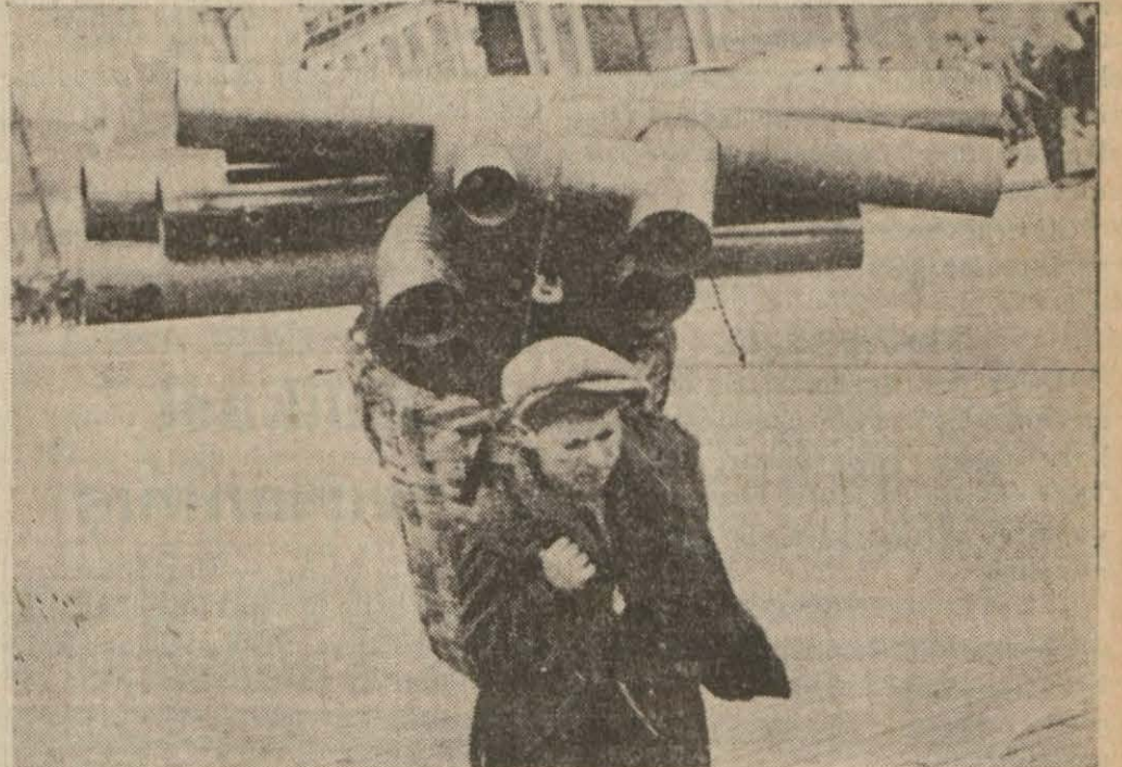
Soğukların birdenbire bastırması yüzünden şehrin her tarafında su borularının taşıdığı görülmüyor

Odun ve kömür fiyatlarında ihtikâr yapanlar şiddetle cezalandırılacak