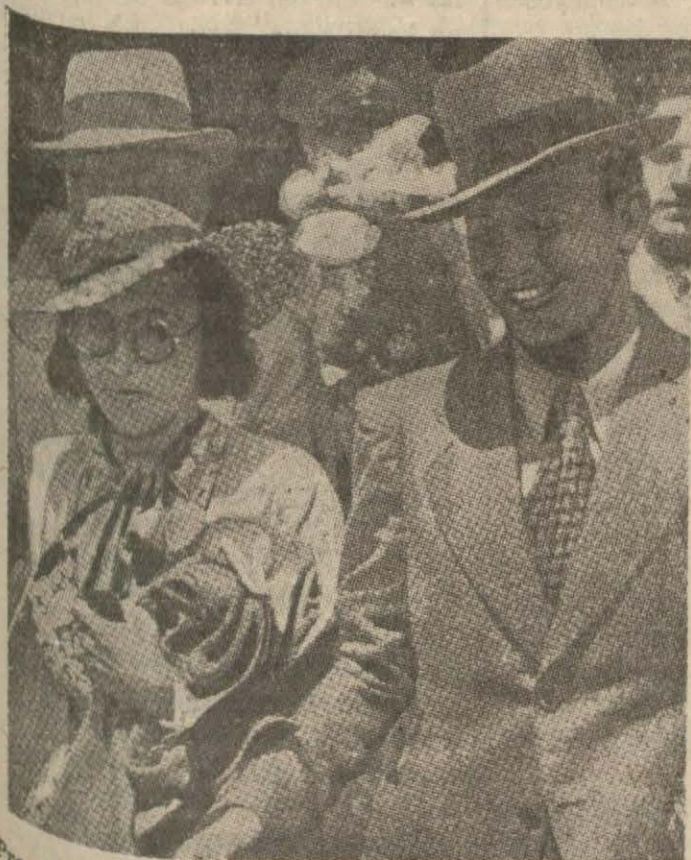
Prensese Haralambi nikâh merasiminden sonra kiliseden çıkarılarken

Eski otel kapıcısı karısına sormadan yaptığı bir mukave- lelenin cezasını mı çekecek?