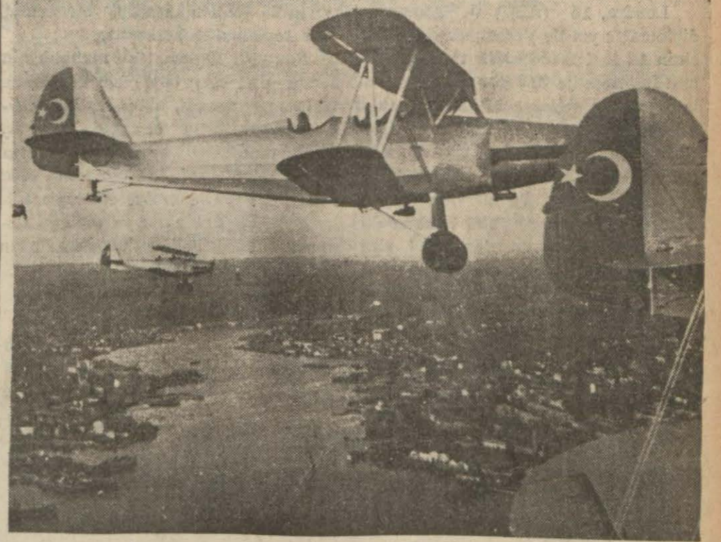
Istanbul tayyarelerinden biri şehrin üzerinde

Haydar Rifat tarafından çok güzel bir lisanla ve bilhassa gazetemiz için dillimize çevrilen bu eseri unutulmaz bir lezzetle okuyacaksınız.