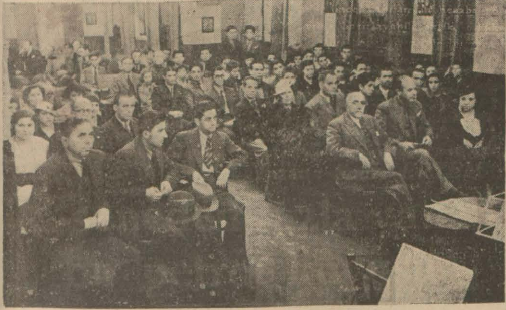
Eminönü Halkevindeki törenden görünüş

Şehrimizdeki Halkevlerinde ve memleketin her yerinde büyük törenler yapıldı