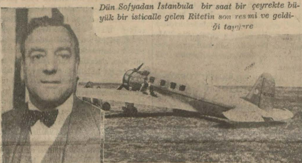
Dün Sofyadan İstanbul'a bir saat bir çeyrekte büyük bir isticalle gelen Riketin son resmi ve geldiği taryjre

Dil Bayramının dünkü kutlanma törenine dair yazı 7 nci sayfamızda