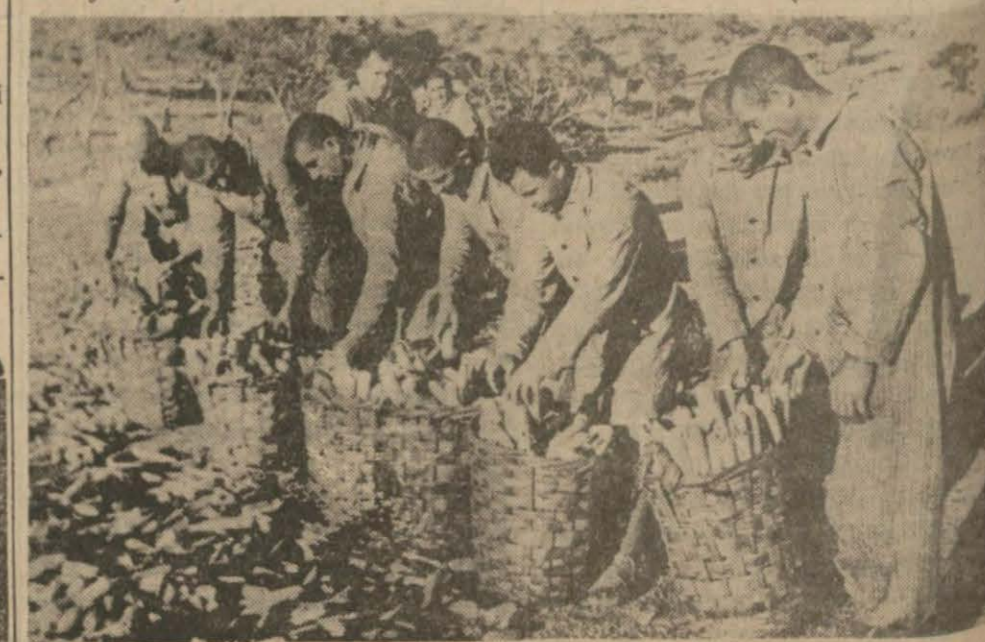
Mahkûmların İmralıda yetiştirdikleri mısırlar

Muhafaza işi, iki jandarma ile bir gardiyana bırakılmıştır. Katiyen kaçmak niyetinde olmadıklarını söyleyen mahkûmlar, lâfife yollu, kendilerini değil, asıl bunları mahpus farzediyorlar; kendilerine nezaret, ken-