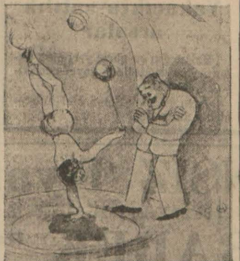
Varyete direktörü — İyi hoş amma sağ elinde de bir top tut tabißen pek iyi bir numara olur!.

Bakan şehrimizde bir hafta kadar kalacaktır.