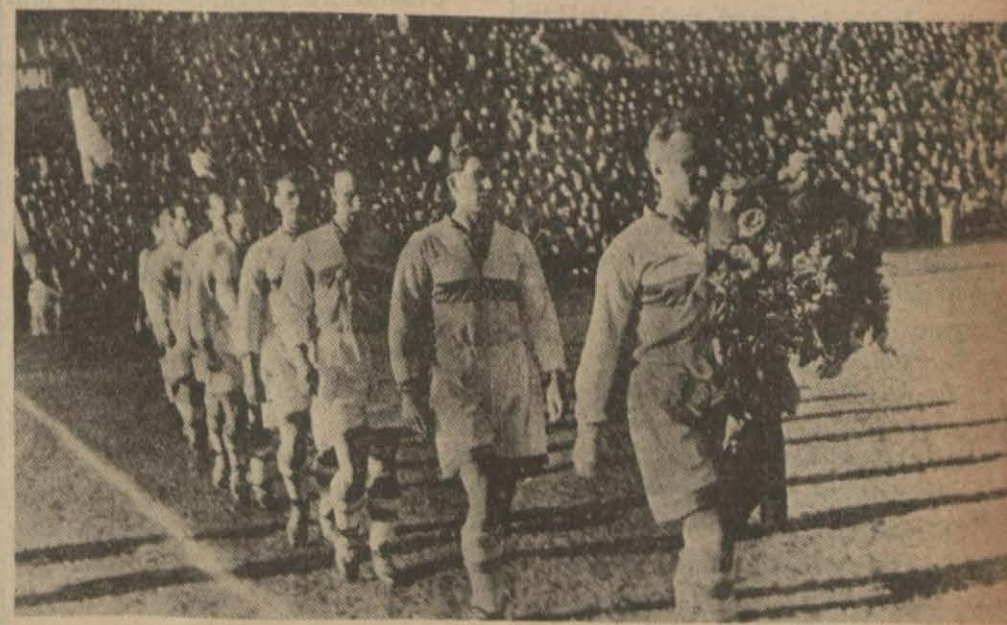
İlk müsabakada Sovyet futbol takımı sahaya çıkıyor

ikinci güreş ve eskrim karşılaşmaları nasıl oldu?