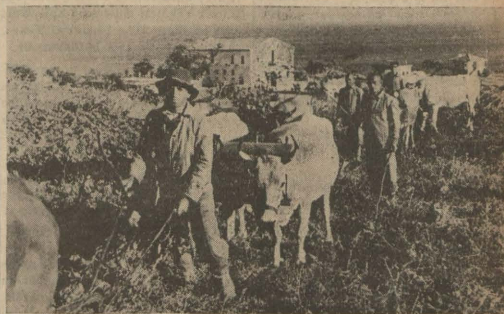
Açık havada çift süren mahkûmlar

4 — Bu esas dahilinde, Türk lirasının diğer dövizlere nazaran kıymet nisbetlerini Merkez Bankası vakit vakit hesap ve ilân edecektir.