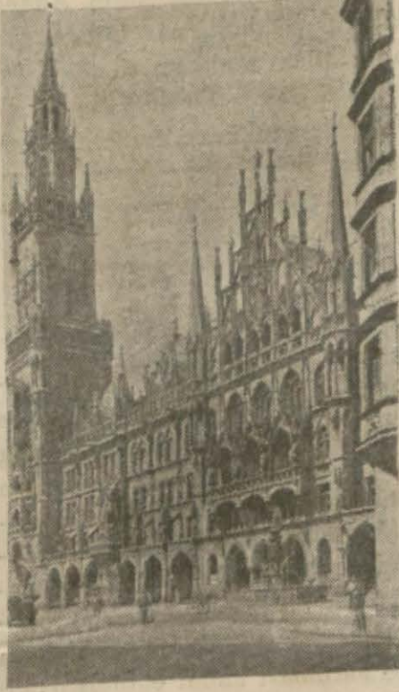
Münih'ten bir görünüş