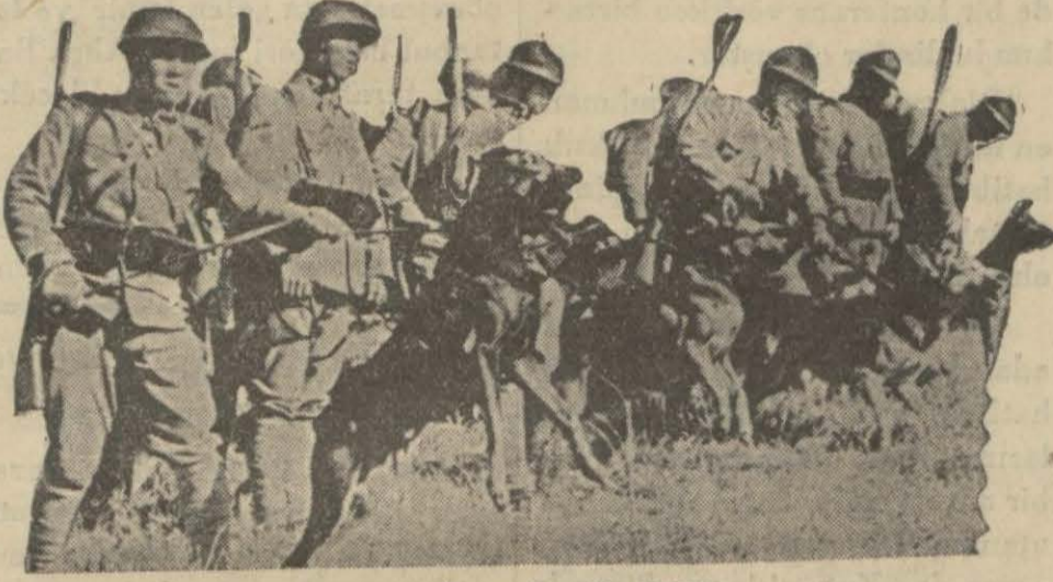
Japon ordusunun bir bölük.

Bir bombardımanda elli Çinli öldü; Japon kuvvetleri icab ederse Çin seddinin ötesine de geçecekler