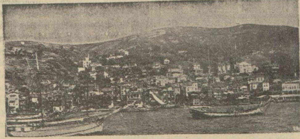
Büyükdere'den bir görünüş.

Büyükdere, çok rağbet gören bir gezme yeridir.