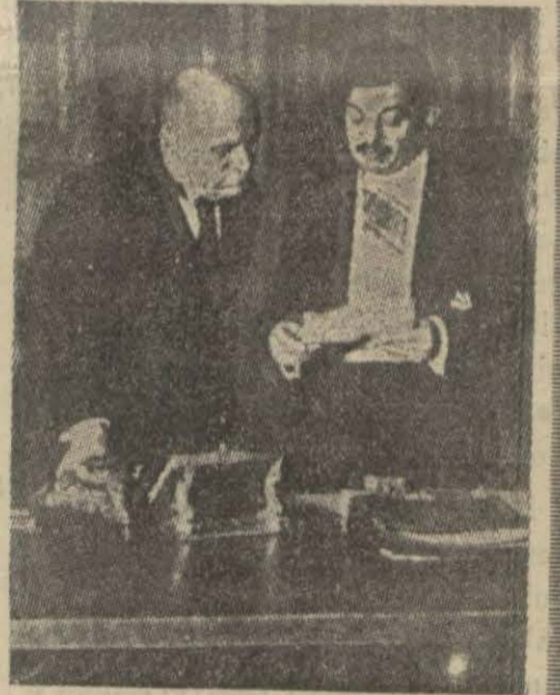
Laval'le Musolini konuşuyorlar Dahiliye ve Korporasyon Bakanlıklarıdır.

Hiçbir değişiklik yapılmıyan Bakanlıklar bizzat bay Musolininin idare etmekte olduğu Bakanlıklardır ki bunlar da Başbakanlık, Dışbakanlık, Harbiye, Bahriye, Hava İşleri,