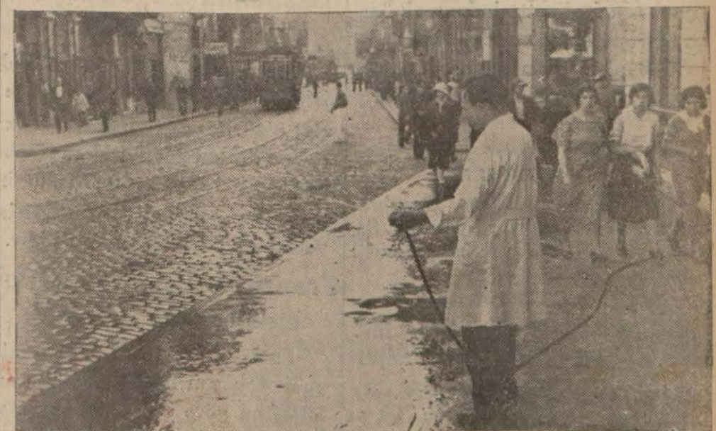
Sıcığa karşı koymak için dükkânın önünü suluyan eczacı

Dün İstanbul'da bunaltıcı bir sıcaklık vardı. Erkekler arasında cecaklık vardı. Kadınlar arasında cecaklık vardı. (Lütfen sayfayı çeviriniz)