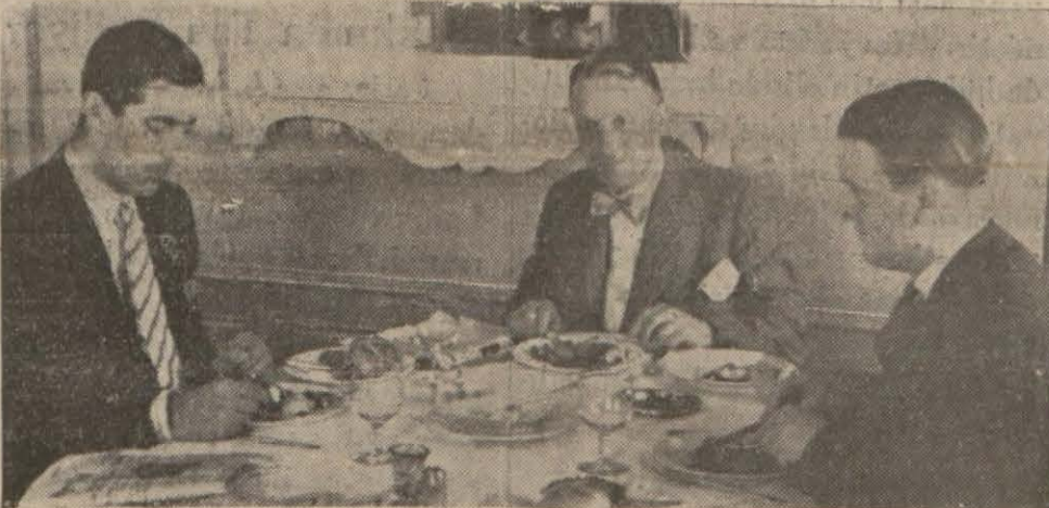
İngiliz gazetecileri İstanbula gelir gelmez sofraya oturdular

Otomobille gelen İngiliz gazetecileri oruntakları yolculuklarını anlatıyorlar