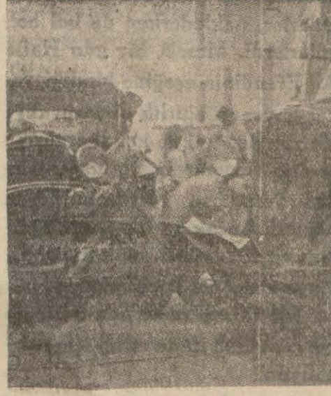
Çarpışan otomobile otobüs

Izmir, (Özel) — Valimiz General Kâzım Dirik'in otomobili, Güzelyalıda Bay Zeynel idaresindeki bir şehir otobüsü ile çarpışmış, parçalanmış ve vilâyet şoförü Bay Zeynel ayağından yaralanmıştır. Vali, otomobilden biraz evvel inmiş bulunuyormuş.