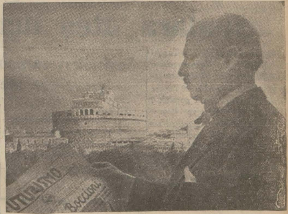
Tanınmış İtalyan Şairinin Romada alınmış bir resmi