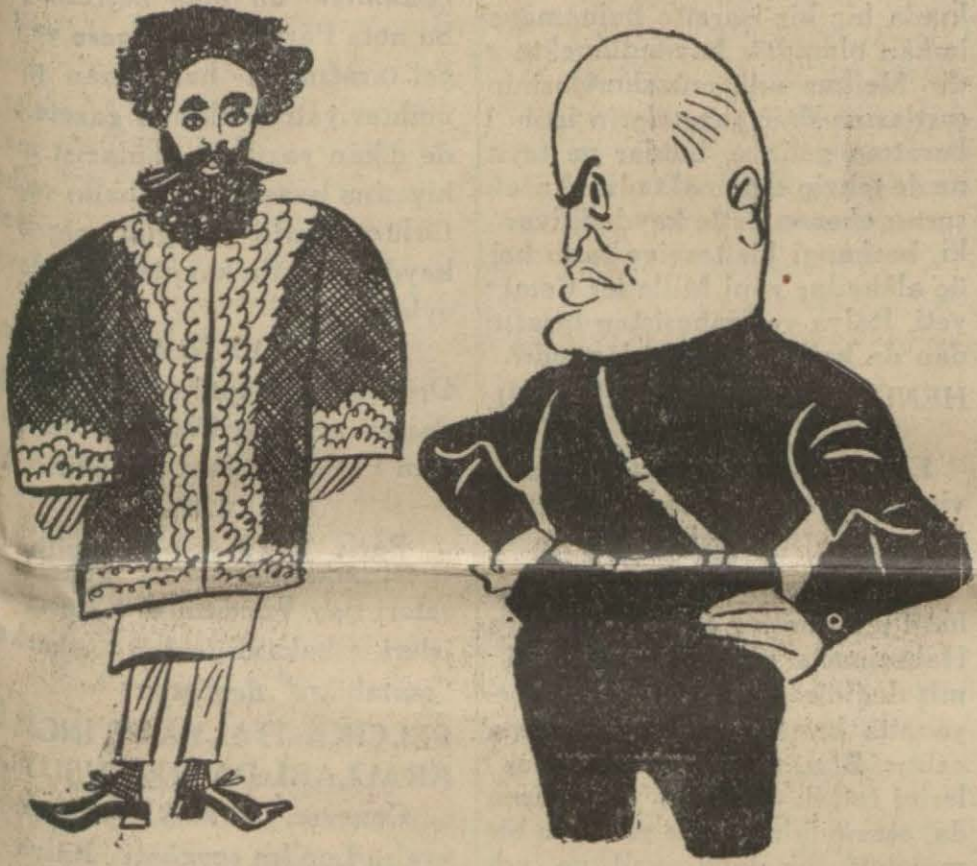
Musolini ile Habeş İmparatoru

Musolini dün sustu İtalya işgal ettiği yerleri bırakmak istemiyecemmiş