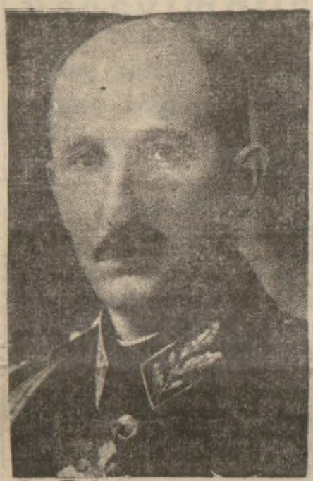
Orduda mühim tebeddülât yapan Bulgar Kralı Majeste Üçüncü Boris

1 — İstanbul Üniversitesi Hukuk, İktisad ve Edebiyat Fakülteleriyle yüksek Ticaret Okulu ve Güzel Sanatlar Akademisinin kamplara tâbi talebeleri birinci devreye dahil olduklarından bunların nihayet 18 Ağustos 1941 tarihine kadar kayıt için İstanbul talim taburu komutanlığına müracaat etmeleri lâzımdır.