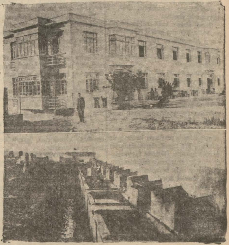
Üstte: Gönenin modern kaplıcaları. Alttı: Yeni yapılan parasız çamaşırhanenin dahili

İnsan böyle her müşküli yenmesini bilen yaratıcı kabiliyette memurları gördükçe memleket namını iftihar duyuyor. Anadoluda bil-