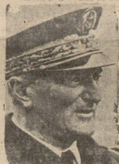
Bütün askeri salâhiyetler şahsında toplanan Amiral Darlan

Malûm olduğu üzere birkaç bin kilometre uzunluğunda olan Alman - Sovyet cephesi başlıca üç (Devamı 3 üncü sayfada)