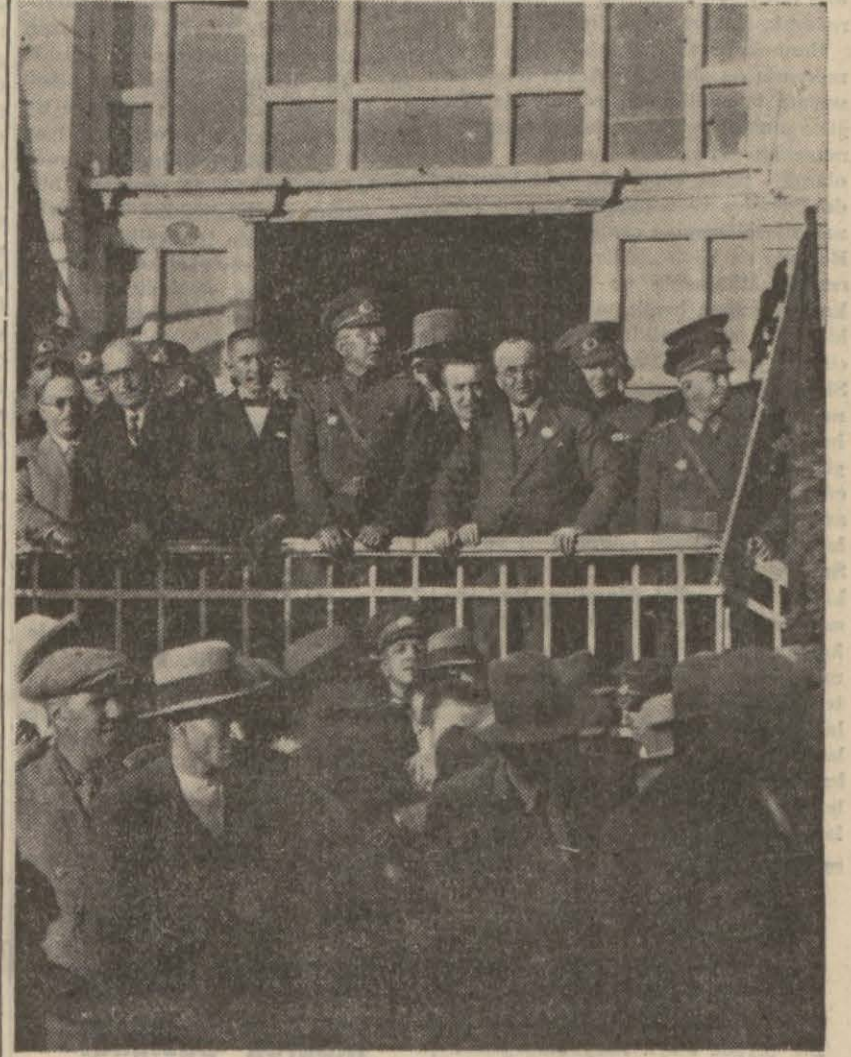
Örfî idare komutanı Ali Rıza Artuokalmı bir merasim sırasında halk arasında alınan resmi...

Örfî idare komutanlığı refakatinde lüzumu kadar askerî mahkeme teşkil olunur. Bu mahkemelerin asil ve yedek askerî ve askerî adli hâkimleri, zabıt kâtibleri ve diğer memur ve müstahdemleri Millî Müdafaa Vekili tarafından itihaz ve tayin olunur. Müstacel ve zarurî hallerde örfî idare mahkemeleri teşessüs edinceye kadar mahallî hâkim ve Cumburiyet Müddeumumileri askerî adli hâkimin vazifesini görür. Örfî idare altına alınan yerlerde muayyen fiilleri işleyenler veya bu fiillere iştirak edenler, Örfî idare komutanı tarafından