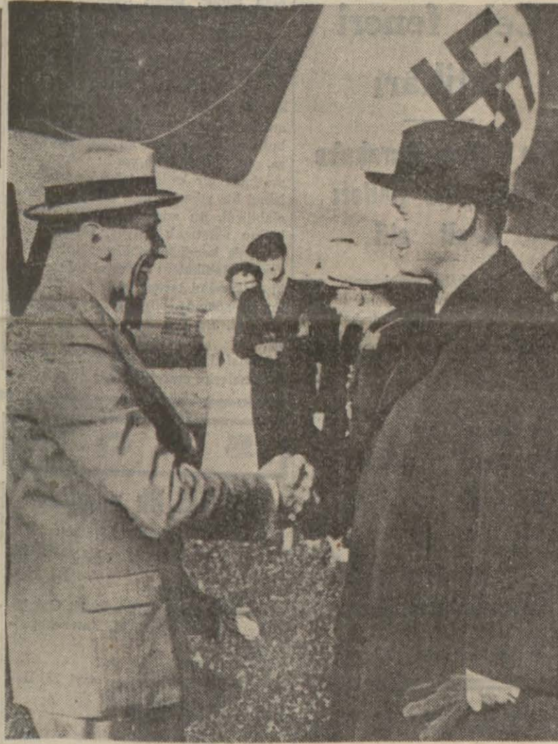
Von Papan Berlin'den memleketimize dönmüştür. Büyük elçinin, geçen sene, Sovyet - Alman muahedesi imzalanmak üzere Moskova'ya gitmekte olan Alman Hariciye Nazırı von Ribbentrop'u, tayyare meydanında tesvi ederken alınmış olan bir resmini yukarıda görüyorsunuz.