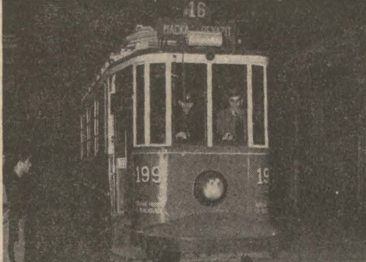
Dün gece karanlıkta kalan İstanbuldan iki manzara: Bir tramvay arabası ve Köprüden İstanbulun görünüşü...

İlk tecrübe muvaffakiyetli ve hâdisesiz oldu