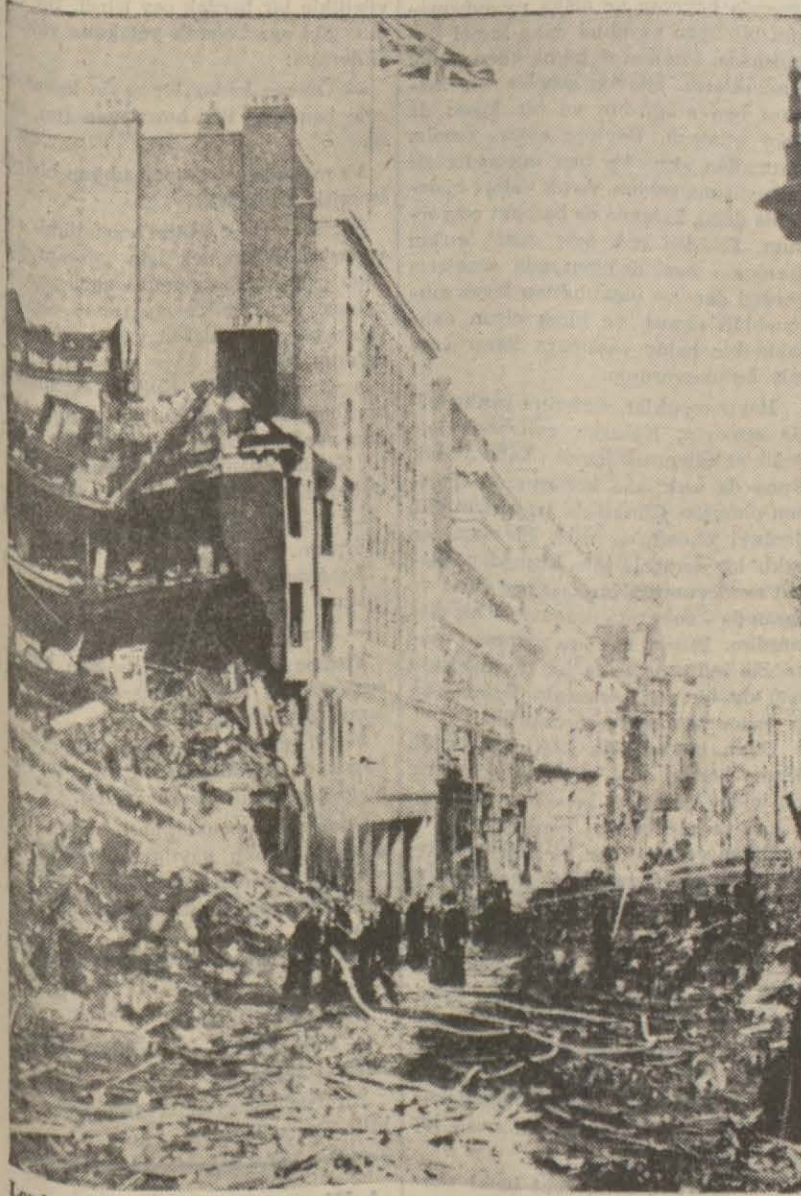
Londraya yapılan mütemadi hava hücumlarının eserleri: Harab olmuş binalar...