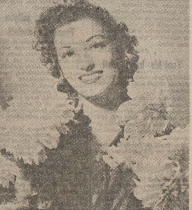
«Çıldırıcı Seytan» lakabını almış olan güzel Viviane Romance

Bu güzel Fransız yıldızını tanımayan, sevmiyen, takdir etmeyen yoktur sanırım.