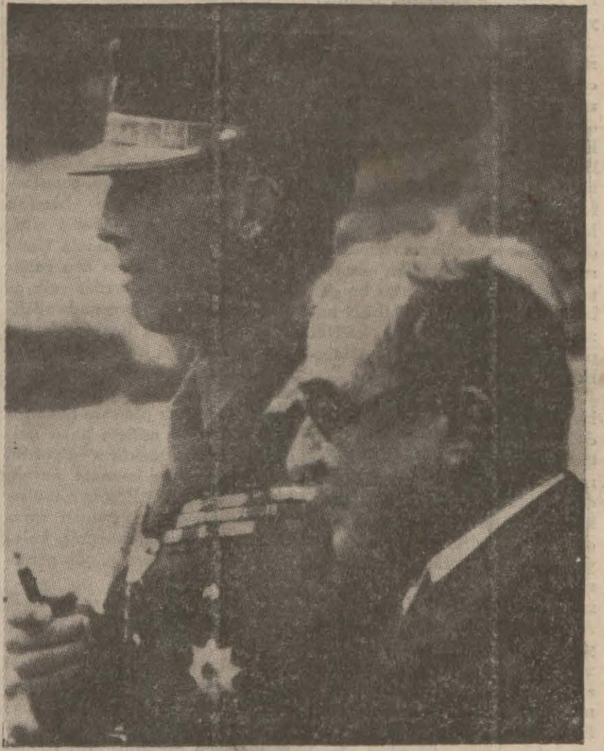
Elener Kralı Jorj ve Başvekil General Metaksas

Yukarıda saydığımız âmil ve bunlara ilâve olunabilecek iğtinabı gayrimümkün mümâsil hâdiseler, fiyatların bir miktar artmasını intac etmiştir. Burada işaret edilmiş lüzum gelen bir nokta da piyasada bütün fiyatların birbirine bağı olduğu ve bazı maddelerde görülen fiyat yükselmesinin istihlal şubelerinin birbirine girift olması dolayısıyla derhal bütün eşya fiyatlarını [Arkası sahife 3 sütun 3 te]