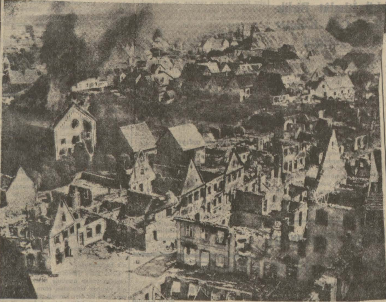
Hava taarruzuna uğrayan bir şehrin hücumdan sonra arzettiği harab ve hazin manzara

Londra 10 (A.A.) «Reuter» — Bu akşam radyoda Riyom mübâkemesi hakkında cihâri bir hitab eden bir Fransızın şefi General de Gaulle demiştir ki: — Fransanın askerî felâketinin mes'ulüleri için bir gün hakiki bir dava cereyan etmektedir. Bugünkü hakîmlerin o gün mazmun saralında bulunacaklarını tahmin etmek için birçok sebebler vardır. Riyom davasının hazırlanış şeklini verilecek kararı evvelinden çürüttüğüne işahâkında Fransız aklı seliminin aldanmadığını söylemiştir. General de Gaulle, bu mes'ullerin müdâvile vasıtalarını hepini bitirmeden ölümlü üyüştürdüklerini ve Fransayı teslim etdiklerini ilâve etmiştir.