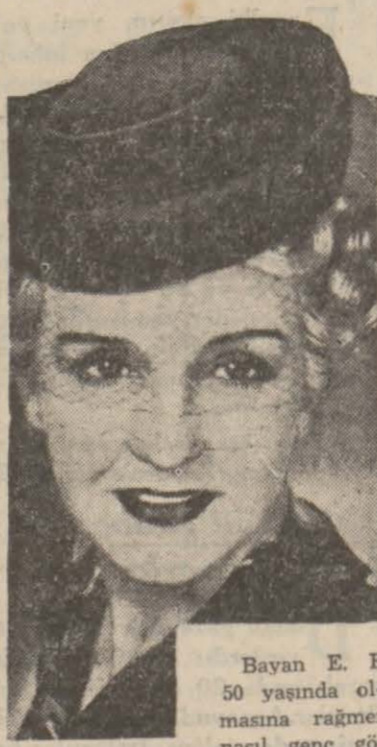
Bayan E. F. 50 yaşında olmasına rağmen nasıl genç görünüyor mu?