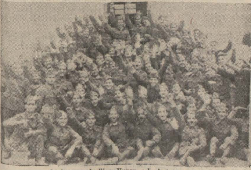
Cepheye sevk edilen Yunan askerlerinin neşesi