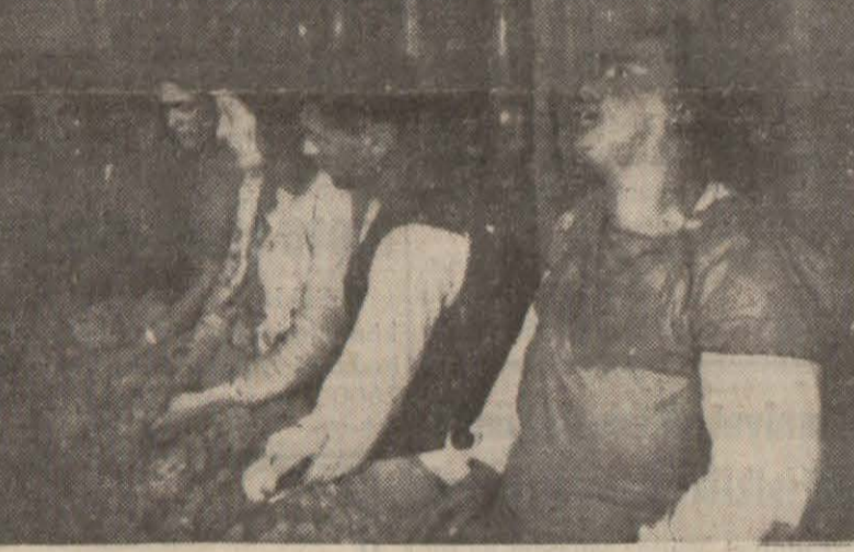
Silivri faciasına aid resimler: Felâketten kurtulanlar Silivri Sinagogunda bekliyorlar

Bratislava 14 (A.A.) — D. N. B. aiansı bildiriyor: Slovakya Cumhuriyetinin men- faat ve mevcudiyeti âleyhine mü- teveccih gayrikanunî bir teşekkül meydana çıkarılmıştır. Bunun neticesinde yeniden bir takım tev- kifat yapılmıştır. Şimdiye kadar tevkif edilenlerin sayısı otuz bul- muştur. Bunların ekserisi daha- nında sol cenah radikal partisine Çeko-Slovakya hükümeti zama- mensub olarak tanınmış kimseler- dir.