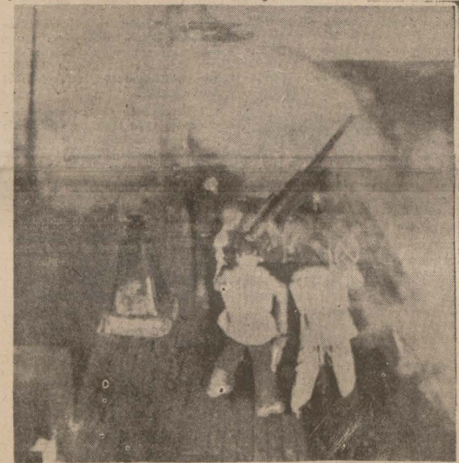
Manş denizinde bir İngiliz gemisi, hücum eden Alman tayyarelerine karşı defî toprakla mukabele ederken

Kahire 8 (A.A.) — İngiliz hava kuvvetleri tebliği: Müteddid keşif uçurları yapılarak kıymetli malûmat elde edilmiştir. Trablusgarb hududunda Bardia limanında vapurlara hücum edilmiş ve büyük bir bina tahrib edilmiştir. Trablusgarb sahillerinde Tobruk mntakasında yapılan bir keşif uçuşu esasında deniz tayyarelerimizden biri düşman tarafından düşürülmüştür. Bu tayyarenin mürettebatından biri ölmüş, diğer üçü yaralı olarak esir edilmiştir. 6-7 ağustos gecesi İngiliz bombardıman tayyareleri şarkî Afrikada Eritre ve Massawa'daki İtalyan denizaltı üslerine hücum etmişlerdir. Alman rapora nazaran bir gemi ile bir denizaltısına tam isabet vaki olmuştur. Yapılan diğer bir hücumda üç gemi hasara uğratılmıştır. Tayyarelerimizden hepsi salimen üslerine dönmüşlerdir. Düşman muharebe tayyareleri dün Mal-taya yaklaşımlarsa da avcı tayyarelerimiz hücumuna meydan vermeden geri dönmüşlerdir.