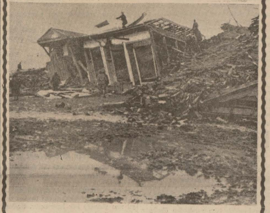
Son zelzelede harab olan vatan köşelerinden...

Ankara 8 (A.A.) — Reisicumhur İnönü bugün öğleden evvel Büyük Millet Meclisindeki dairesinde bir müddet meşgul olmuşlardır.