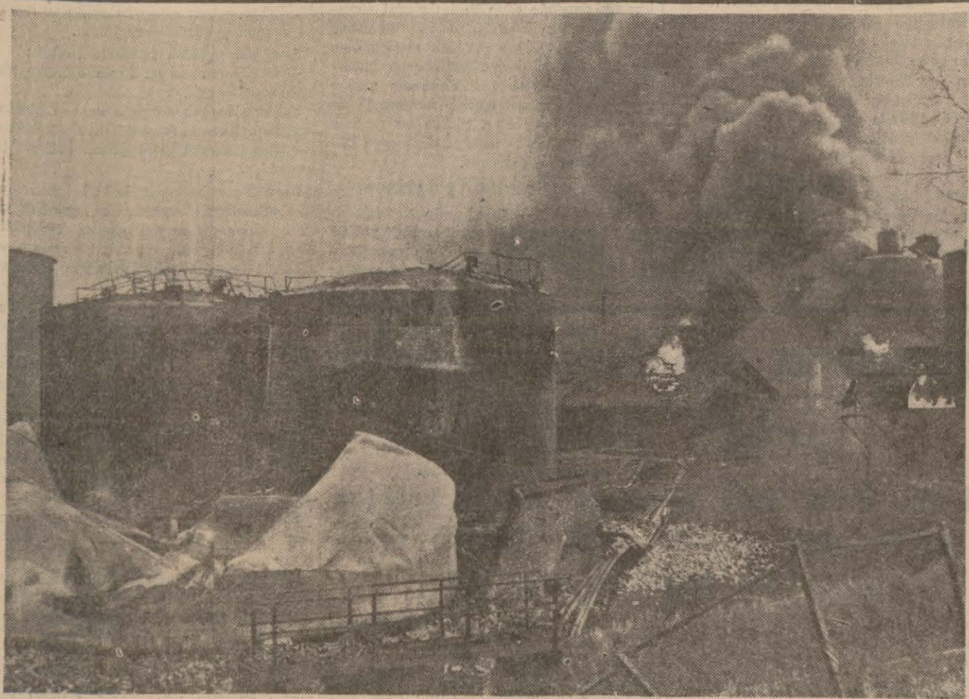
Her gün bir çoğu yakılıp yıkılan Alman endüstri merkezlerinden ve petrol tasfiyhanelerinden biri korkunc alevler içinde