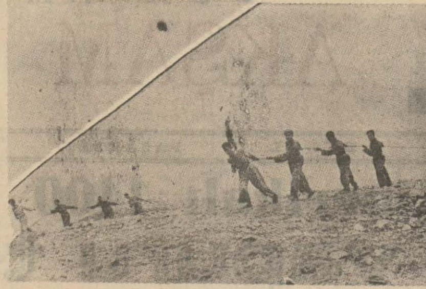
Bu seneki Türkkuşu kampı çok verimli olmuştur. İştirak edenler her senekinden pek fazladır. Bunlar arasında bilhassa lise talebeleri de seriyeti teşkil etmiştir. Yukarıki resimlerde kampta bir plânörün uçuşması için çalışan gençler ile kampta verilen bir ziyafet görülmektedir.

Belediye itfaiyelerimiz için yeni garajlar yapmağa karar vermiştir. İlk olarak Beyoğlu itfaiyesi için Taksimde bir garaj inşası düşünülmektedir.