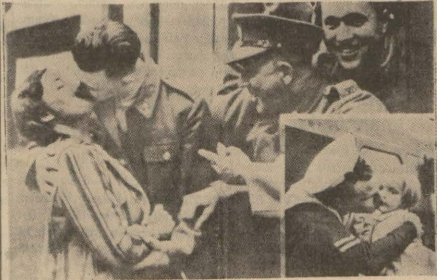
İngilterede askere çağrılanların çoçuk ve karıkrına vedaları... (Yazısı 4 üncüde).

Çemberlayın İngilterenin Alman- ya ile harb haline girdiğini ilân ederken, Hitleri yeniden bütün dünyayı sarsacak büyük felâketin yoçane mes'ulü olarak gösterdi ve İngiliz milletinin girişmek mecbu- riyetinde kaldığı bu harb sonunda