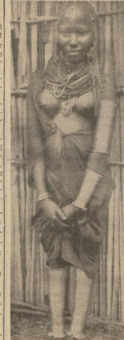
Maden eritmeyi keşfettikten sonra vücutlarını zırh gibi sislerle bezemeye doyanıyan Maza kızları.