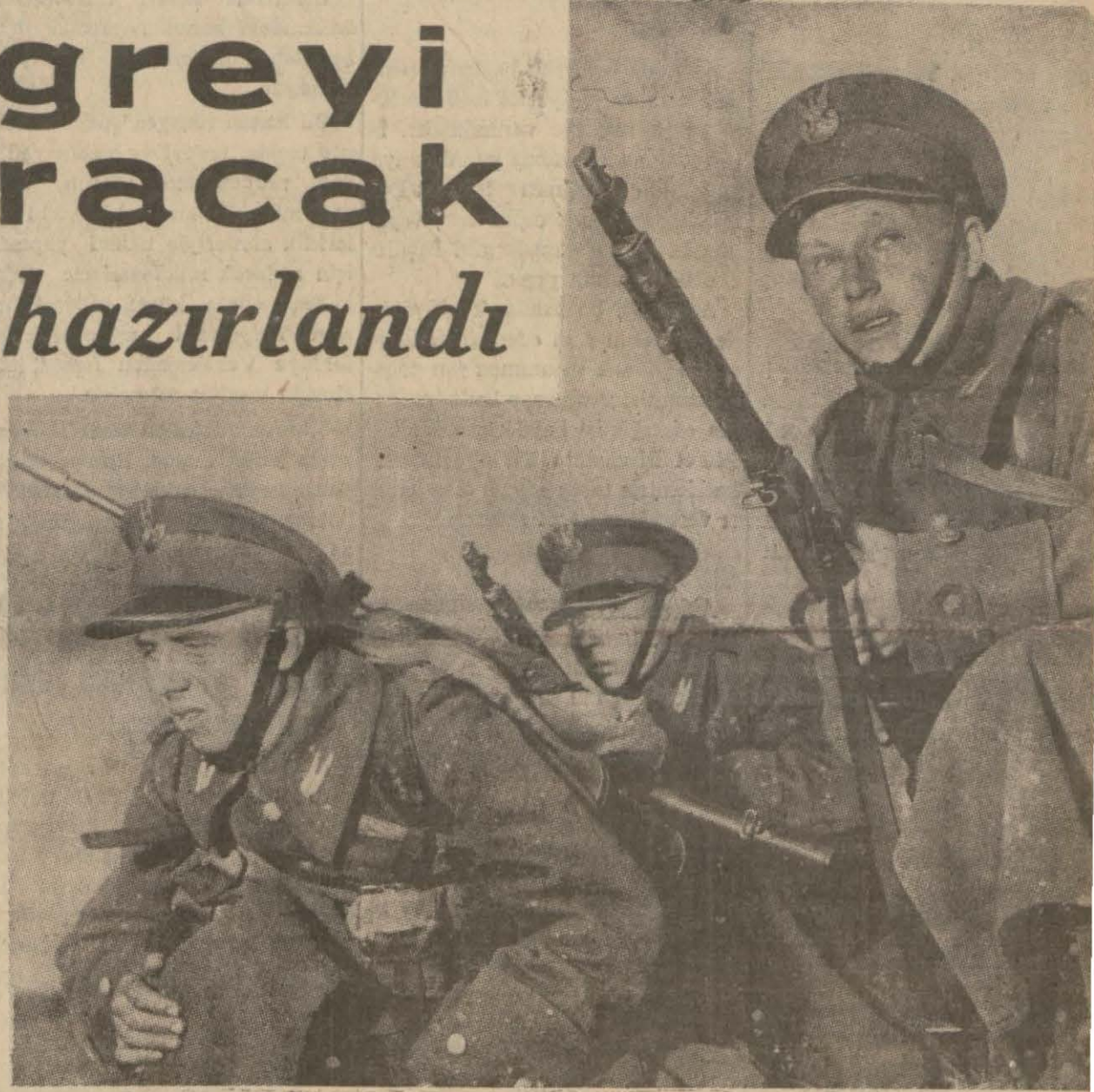
Valankron şiddetle müdafaa eden Leh askerlerinden bir grup...