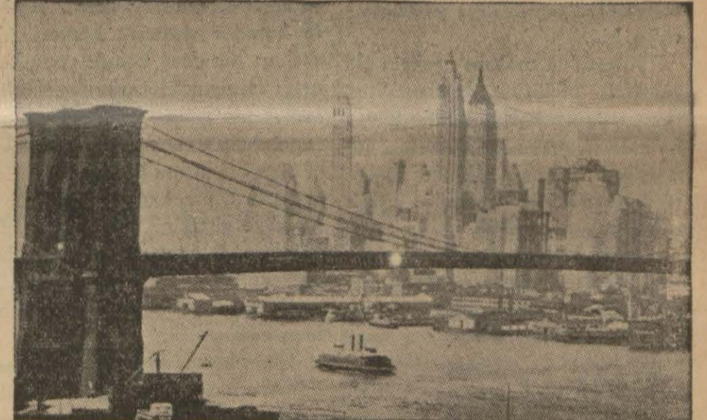
Dünyada mevcut büyük asma köprülerden Newyorkta Bruklin köprüsü

Köprü 11 milyondan fazlaya çıkarsa üstünü ben ödeyeceğim diyor