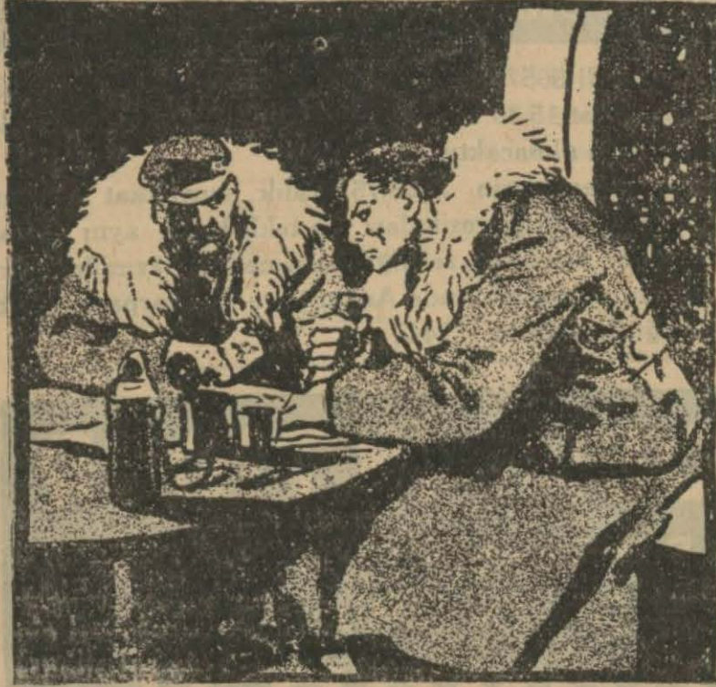
82 — Her ikisi de çok acıktıklarından konserve yemekleri süratle bitiriyorlardı.