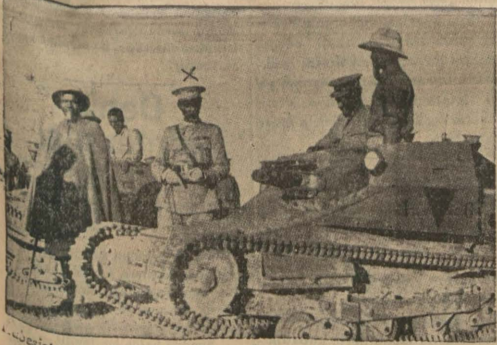
Böğistanın cenup ordusu kumandanlarından General Nasibu İtalyanlardan iğtinam edilmiş tanklar yanında... (Yazısı 4 üncüde)