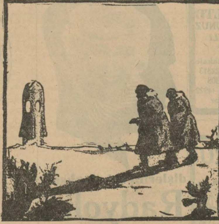
80 — Yolcular bütün gün dolaştıktan sonra akşam üstü güllelerine avdet ediyorlar.