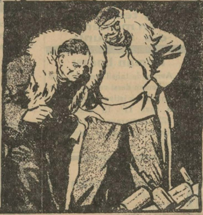
83 — Yolcular her ihtimale karşı el bombalarını hazır bulunduruyorlardı.