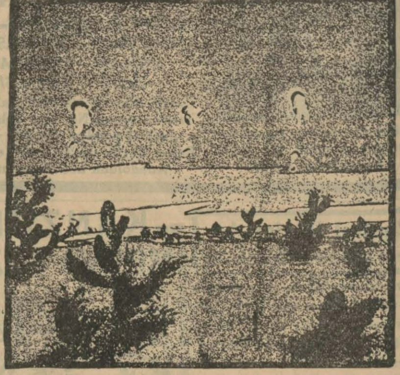
81 — Güneş batmıştı. Ve havanın suhuneti süratle iniyor, hava soğuyordu.