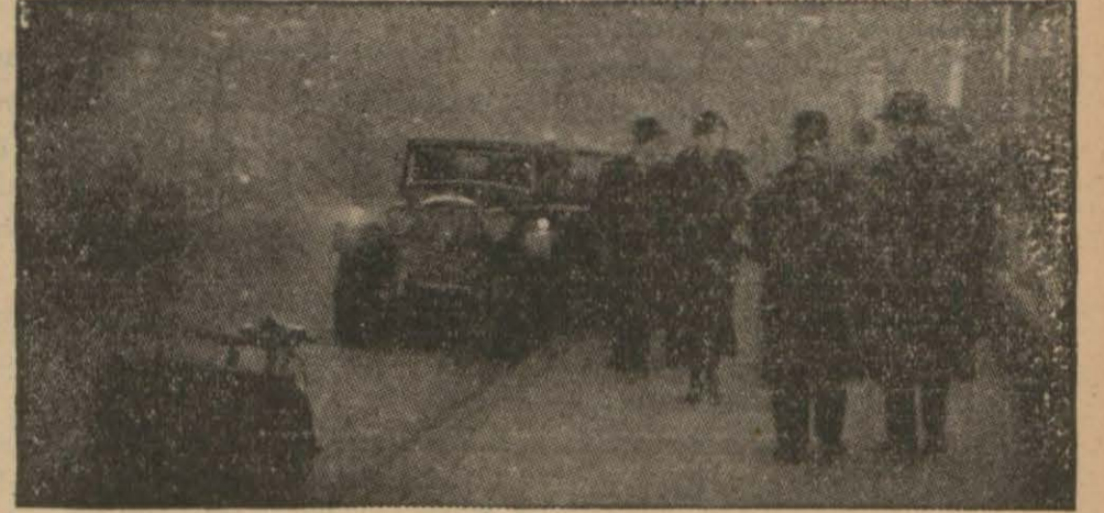
Bu resim Londranın sisli günlerinden birinin öğle vaktini gösteriyor (Yazısı 2 incide)