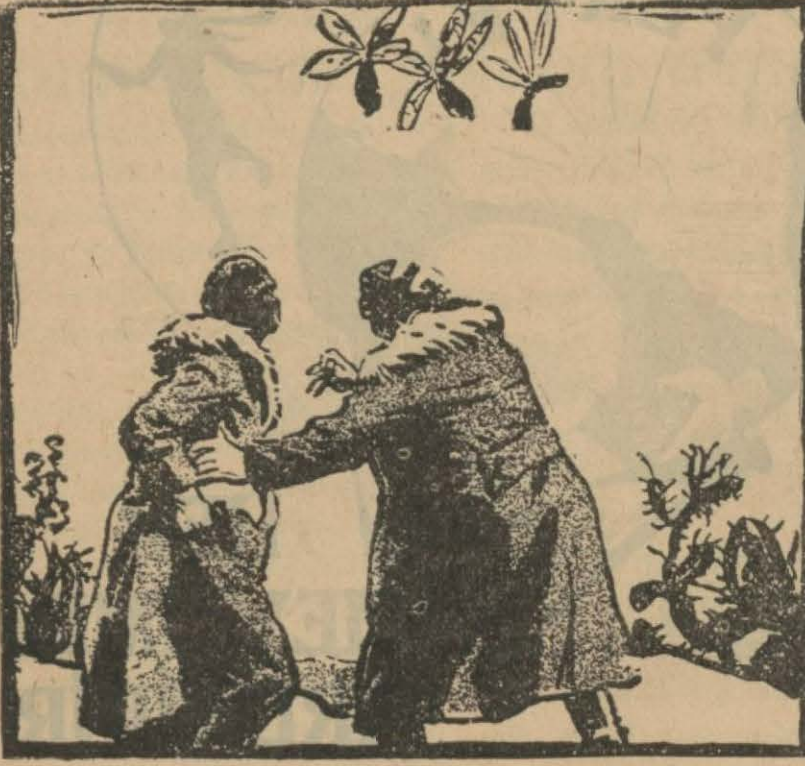
79 — Havada arıya benzeyen kuşlar görüldü. Ivanoviç tabancasını çekti. Los atmasına mâni oldu.