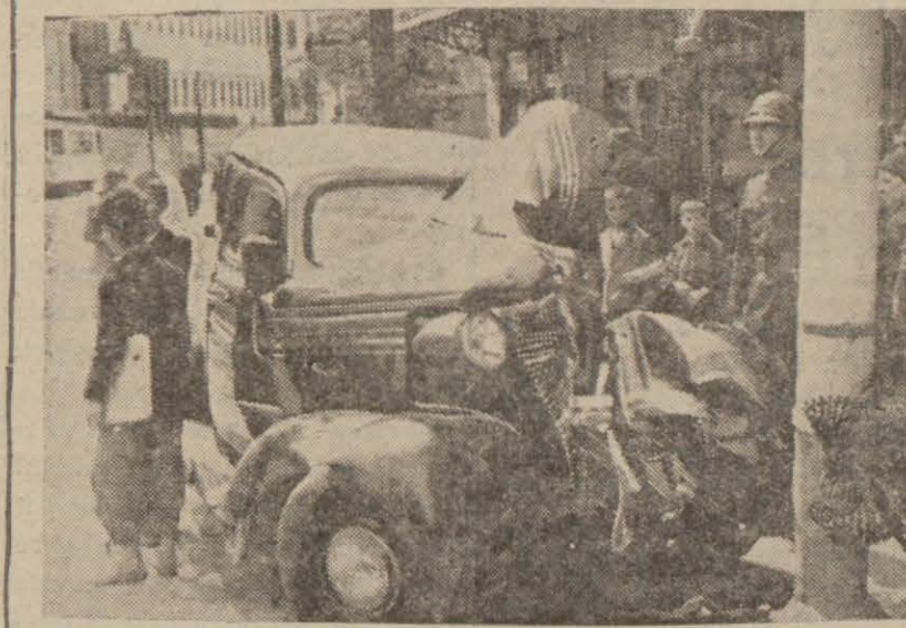
(Yanda, yaralı talebe İhsan Katil otomobil vak'amahallinde n hastanede aldığımız resmi)

Bu tedbire sebep, yahudilerin radyoda aldıkları haberleri devletin menfaatine zarar verecek bir tarzda ağızdan ağıza dolaştırmalarıdır.