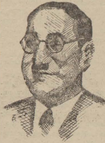
Irak Başvekili Rasid - El - Geylani

Mısır notasına verilen cevabta şöyle deniliyor : Biz ilân edilmiş bir harp karşısındayız!