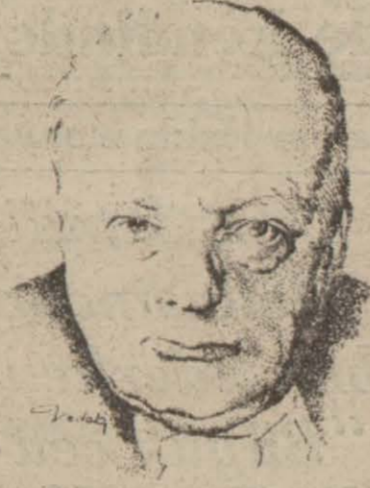
İngiltere Başvekili ÇÖRÇİL

Londra 6 (A. A.) — Röyterin diplomatik muhabiri bildiriyor: