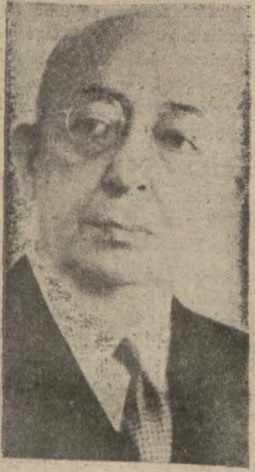
Türkiye Cumhuriyeti Başvekili Dr. REFIK SAYDAM

Bugün Valinin de iştirakile Partide yapılan büyük toplantıda neler konuşuldu? (Yazısı 3 üncüde)