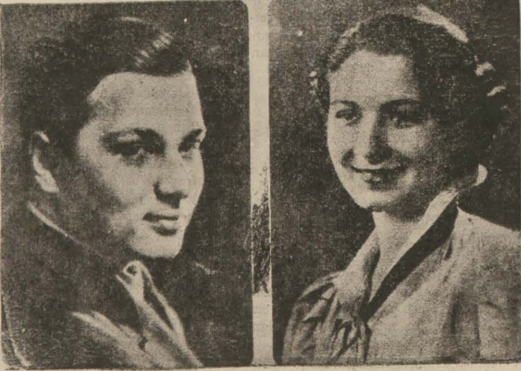
Hariciye Vekilimizi kabul edecekleri bildirilen Majeste Birinci Faruk ve refikaları Hazretleri

Başvekil halkın hislerine samimî bir dille tercüman oldu