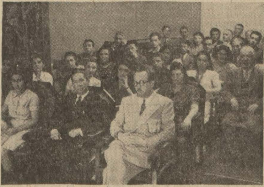
Beyoğlu Halkevinde dünkü merasimden bir intiba