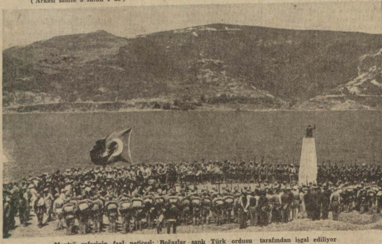
Montrö zaferinin faal neticesi: Boğazlar şarkı Türk ordusu tarafından işgal ediliyor

Lübnan Başvekilinin beyanâtı Londra 21 (a.a.) — Lübnan Başvekilinin beyanâtı (Arkası sahife 5 sütun 2 de)