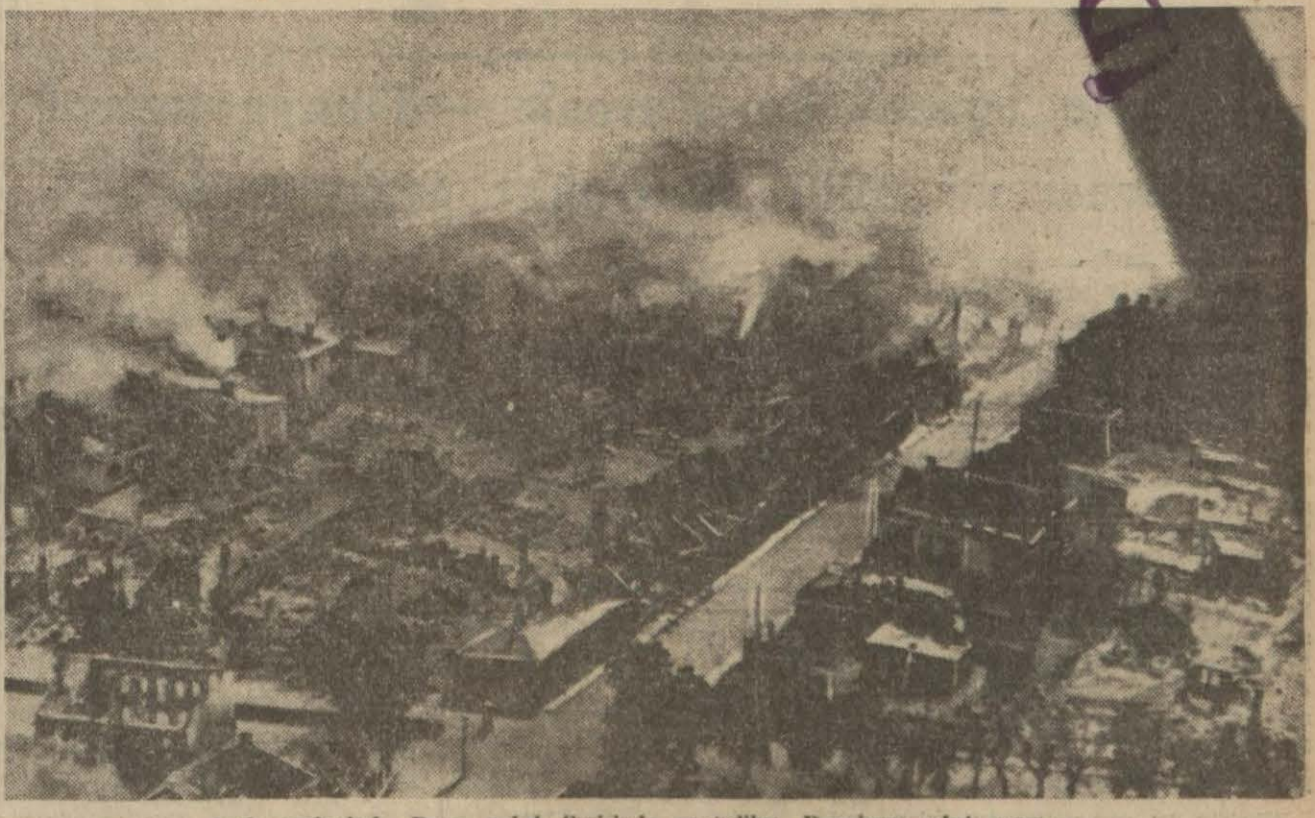
Şark cephesinde Duna nehri ilerisinde zaptedilen Dunaburg şehri yanıyor