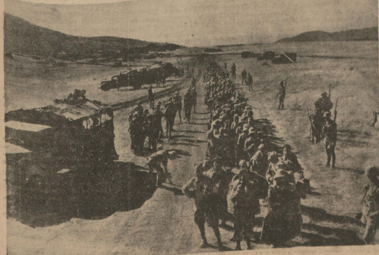
Tabesistanda İtalyanlardan alınan esirlerden bir kafile

Renkli harita serimiz ASYA HARİTASI Bugün 6 ncı sahifede