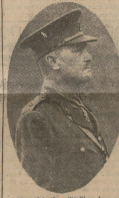
Yunanistanda mütefrik ordusu kumandanı General Freyberg

Kahire 24 (a.a.) - İngiliz Ortasark Başkumandanlığının tebliği: Almanlar Giritteki kut'alarının takviyesi için dün azimli gayretler sarfetmişlerdir. Kandiye ve Resmo'da havadan indirilen paraşütçüler kat'î surette temizlenmiştir. Daha uzak müntakalara indirilen paraşütçüler de Yunanlıların muzaheretle temizlen- mektedir. Malemi ve civarında şiddetli bir mücadeleye devam edilmektedir. Almanlar bidayette tuttukları yeri geniş letmek için esaslı gayretlerini burada sarfetmişlerdir. Pike bombardıman tay-