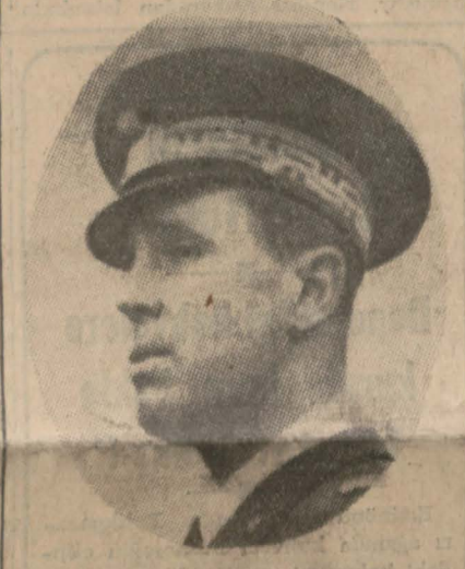
Yunus Nadi'nin, İngiliz zabıtlarına teslim edilmiş bulunan İtalyanların Habeş vâli ve kumandanı Dük d'Aosta

ruz. Ve ancak böylelikle kendimize ve herkese faydalı olacağımız kanaatini din olduğu gibi bugün de muhafaza ediyoruz. Eğer bu siyasette bir değişiklik olacaksa onu mucib sebeplerle birlikte salâhiyetli mes'ul makamların söylemesi muvafık ve lâzımdır. Bir Fransız hava filosu İngiliz kuvvetlerine iltihak etti YUNUS NADI