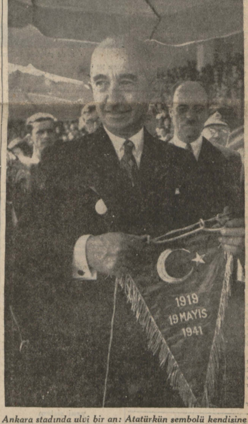
Ankara stadında ulvi bir an: Atatürkün sembolü kendisine teslim edilen Büyük Milli Şefimiz, dudaklarında derin bir tebessüm ve gözlerinde mücadele yıllarının ölmez hatıralarına bir lâhza dalıveren bakışlarla, bayrağı halka gösteriyor

Fransız İmparatorluğu Müdafaa Konseyninin muhtırası Londra 20 (a.a.) — Hür Fransız kuvvetleri umumî kararğahu dün Londrada müessesileri bulunan bütün hükümetlere aşağıdaki muhtırayı vermiştir: