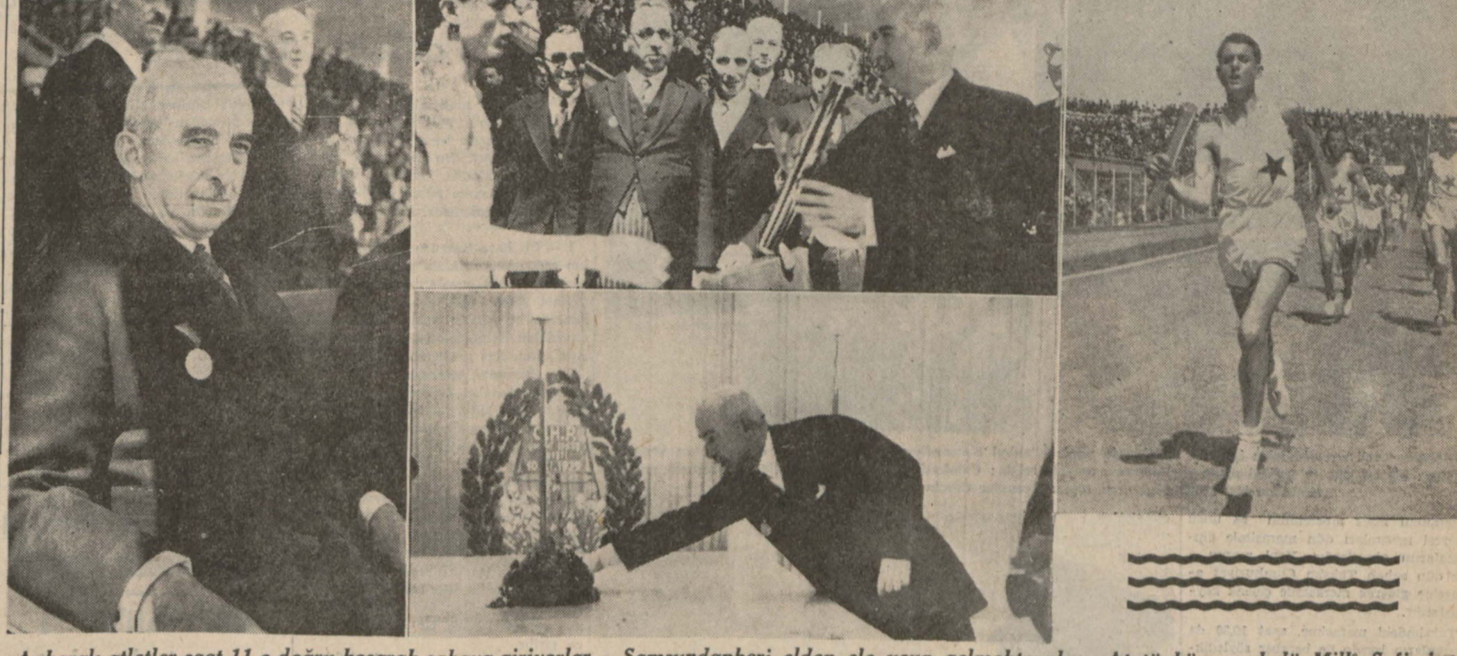
Ankaralı atletler saat 11 e doğru koşarak sahaya giriyorlar - Samsundanberi elden ele uçup gelmekte olan, Atatürkün sembolü Milli Şefimize sunuluyor - Milli Şef derin bir dikkat ve alâka havası içinde gençlerimizin tezahüratını takib buyuruyor - Aziz Milli Şefimiz 19 mayıs sabahı her şeyden evvel büyük arkadaşı Mustafa Kemalî düşünmüş ve onw kabrini ziyaret ederek lâhdine taze çiçekler koymuştur. (Gençlik bayramına aid diğer resimler 5 inci sahifemizedir)