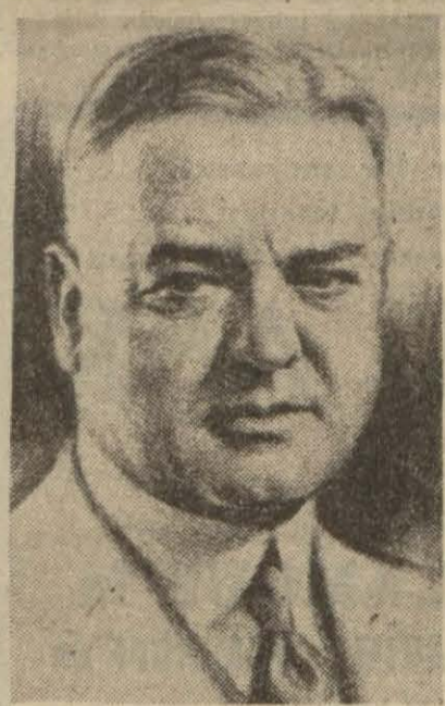
Amerikanın eski Cumhur Reisi Mr. Hoover