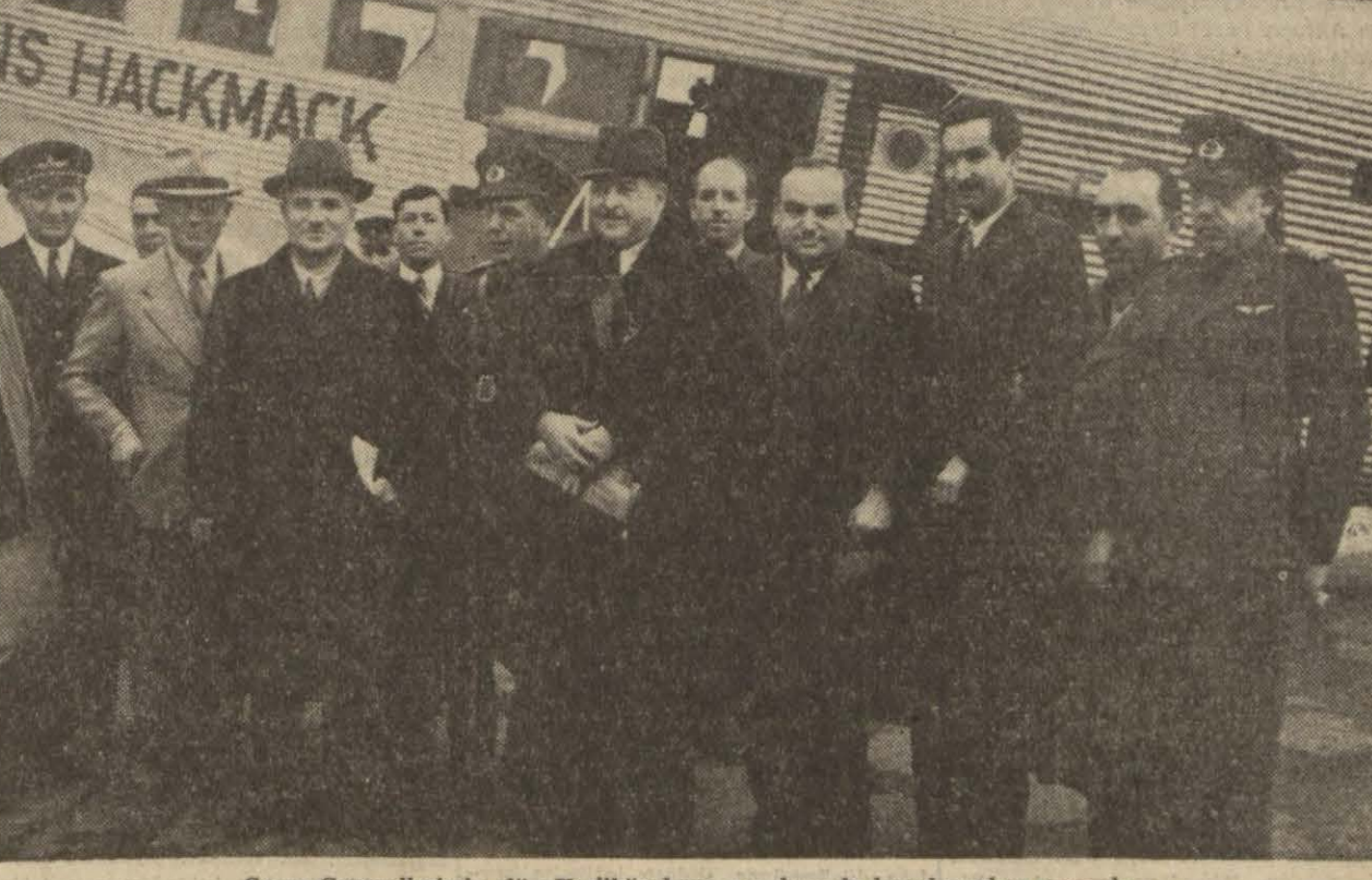
Sayın Generallerimiz, dün Yeşilköy hava meydanında karşılayıcıları arasında