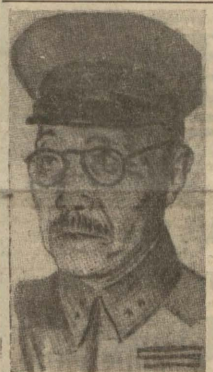
Japon Başvekîli Tojo

Toplantı çok samimî bir hava içinde geç vakte kadar devam etmiştir.