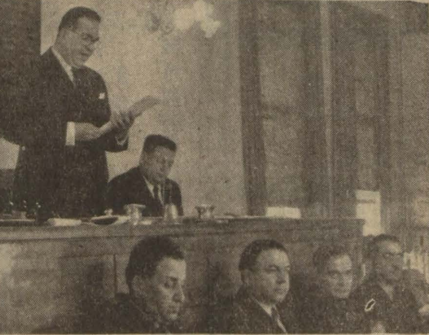
Vali ve Belediye Reismiz Lûtfi Kırdar, dün Şehir Meclisinde konuşurken

İstanbul Umumî Meclisi dün Vali ve Belediye Reisi doktor Lûtfi Kırdarın riyasetinde toplandı. Bundan evvelki celsede Taksimdeki gezyiye İnönü gezisi namı verilmesi ve burada Millî Şefimizin bir heykelinin dikilmesi kararlaştırılmıştı. Bu münasebetle Millî Şefimize çekilen tazim telgrafına gelen aşağıdaki karşılık okundu. «Doktor Lûtfi Kırdar: Vali ve Belediye Reisi. İstanbul Belediyesi'nin iyi yürekli duygularına çok teşekkür ederim. Belediyenin kararını sevdiğim bir işaret olarak alıyorum.»