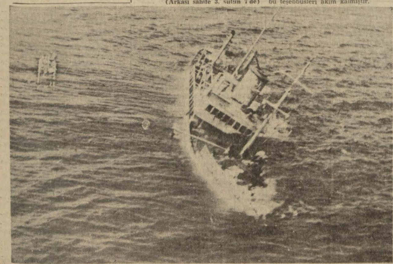
Atlantikte torpilleşen bir vapur, ağır ağır sulara gömülürken

Gerek Yunanistana, gerek diğer muhtâc memleketlere gönderilecek Amerikan YUNUS NADİ (Arkası sahife 3, sütun 4 te)