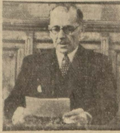
Hariçye Vekili ve Başvekâlet vekili Şükrü Saracoğlu

Başvekâlet vekili Şükrü Saracoğlunun izahat vermesi muhtemel