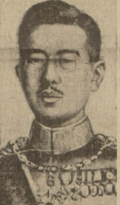
Japon İmparatoru Hirohito

Japonya harb ilân etti Vaşington 7 (a.a.) — Rüyter: Japonya Birleşik Amerika ve Büyük Britanya harb ilân etmiştir. Tokyodan buraya gelen bir mesaja göre, Japon İmparatorluğu umumi karar-gâhi Japonyanın bu sahad fevri vakitinden itibaren batı Pasifikte Birleşik Amerika ve Büyük Britanya ile harb halinde olacaktır.