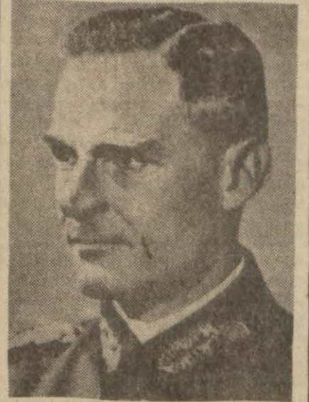
Fransadaki işgal kuvvetleri kumandanı General Von Stulpnagel

Ankara 23 (a.a.) — Anadolu ajansının salâhiyetler mahafiden öğrendiğine göre Almanya hükümeti, bir üçüncü Türk vapurunun da mürettebatı Sovyet işaretlerini taşıyan, Alman ajanları olacak, milliyet bilinmeyen bir denizaltı tarafından batırılacağı hakkında Tass ajansının dün gece nesrettiği habere atfen Karadenizde bir tek Alman denizaltısı olmadığını Ankaradaki büyük eicliği vasıtasıyla hükümetimize resmen bildirmişti.