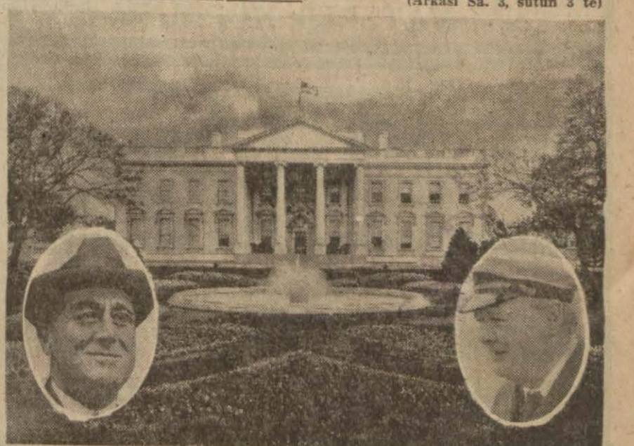
Vaşingtonda Reiscumhurun ikametgâhi olan «Beyaz ev» den bir görünüş, solda ve sağda M. Ru zvelt ve M. Çörçil