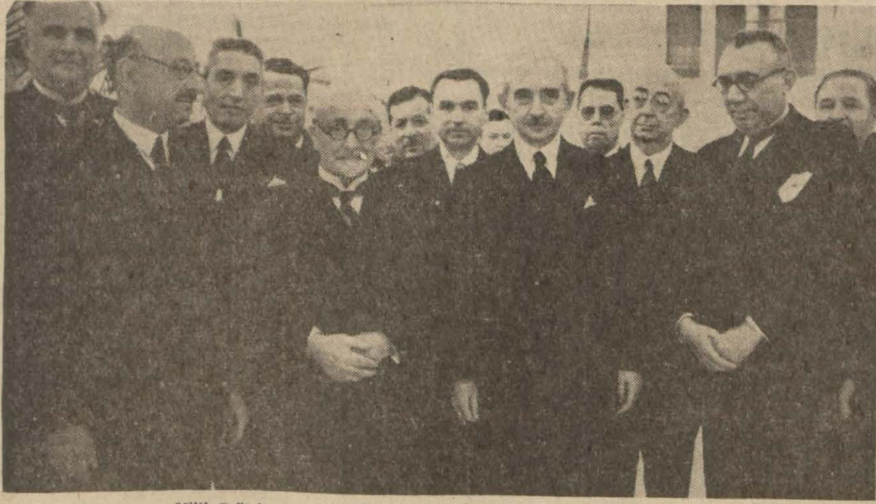
Milli Şefimiz, geçen seneki ziyafetlerinden birinde, davetlileri arasında

Ankara 23 (Telefonla) — Büyük Millet Meclisi azasından elli kadar mebusumuz bu akşam yemeğinde Çankaya köşkünde Cumhur Reisinin davetlisi olarak bulunmuşlardır.