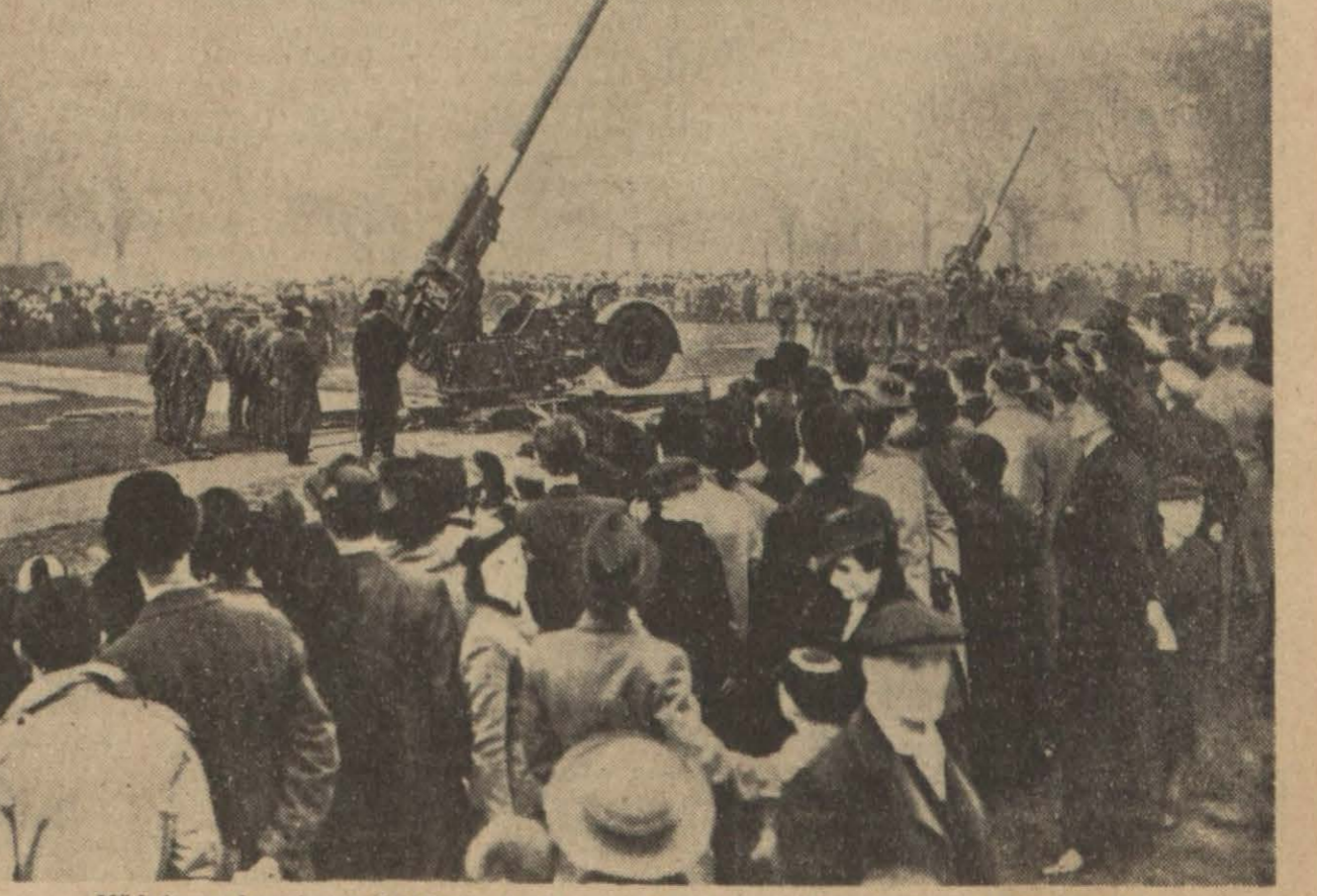
Müdafaaaya hazırlanan Londra'da bütün meydanlara hava defî bataryaları konulmuştur.

İngiliz ordusu düşmanını karşılamak üzere hazırlıklarını bitirdi