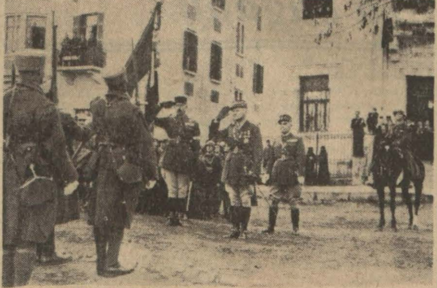
Daftınmakta olan Suriyedeki Fransız ordusunun eski kumandanı General Weygand, Beyrutta, bir merasim esnasında

Almanya ve İtalya, Beyruta siyasî mümessiller göndermişler