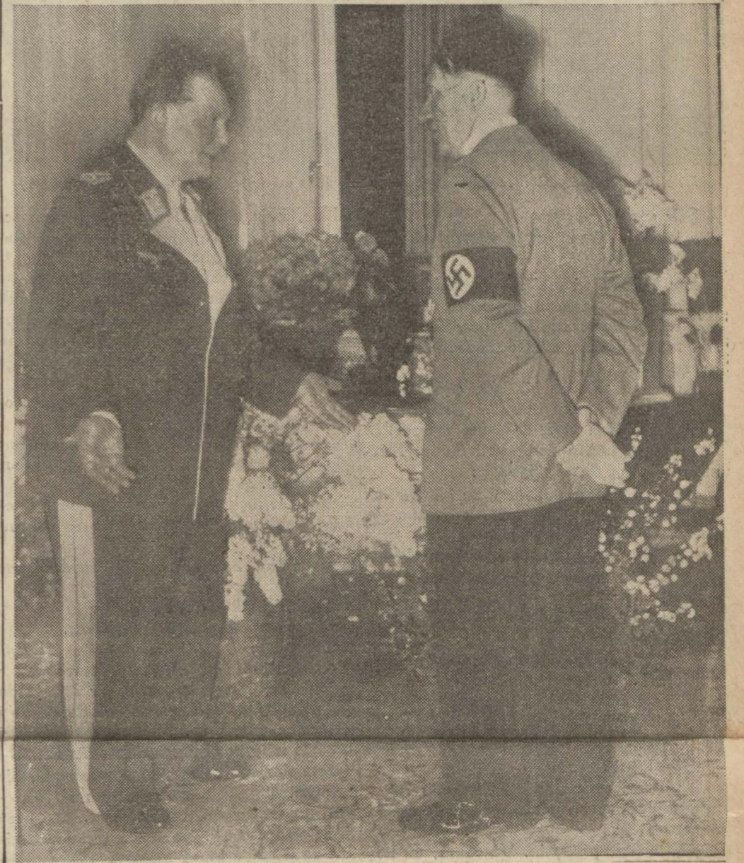
Hitler ve Göring hususî bir müşahabe esnasında başbaşa

Yeni plânın tatbikına Mareşal Göring memur edildi