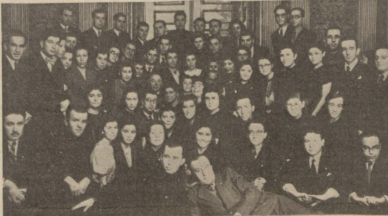
Rektör Cemil Bilsel, Fen Fakültesi talebeleri arasında (Yazısı ve Edebiyat Fakültesi talebelerine aid resim 5 inci sahifemizde)

Üniversitelinin ezeli derdi! Rektörün dünkü çayında kitabsızlık hocasızlık acısı bir daha anlatıldı