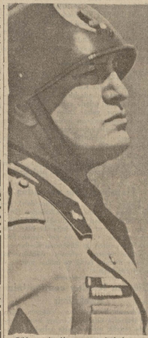
Ribentrop'a, Almanyanın pek de hoşuna gitmeyecek cevaplar verdiği anlaşılınca İtalyan Başvekilini Mussolini

Alman tahkimatına dair mühim bir tetkik yazısı