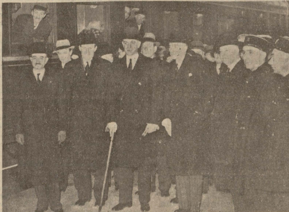
Amerika Hariciye Müsteşarı Welles, Pariste Fransız Nazırları tarafından karşılanıyor

Bu teşebbüse Papa ve Mussolini'nin de müzaheret edeceği anlaşılıyor