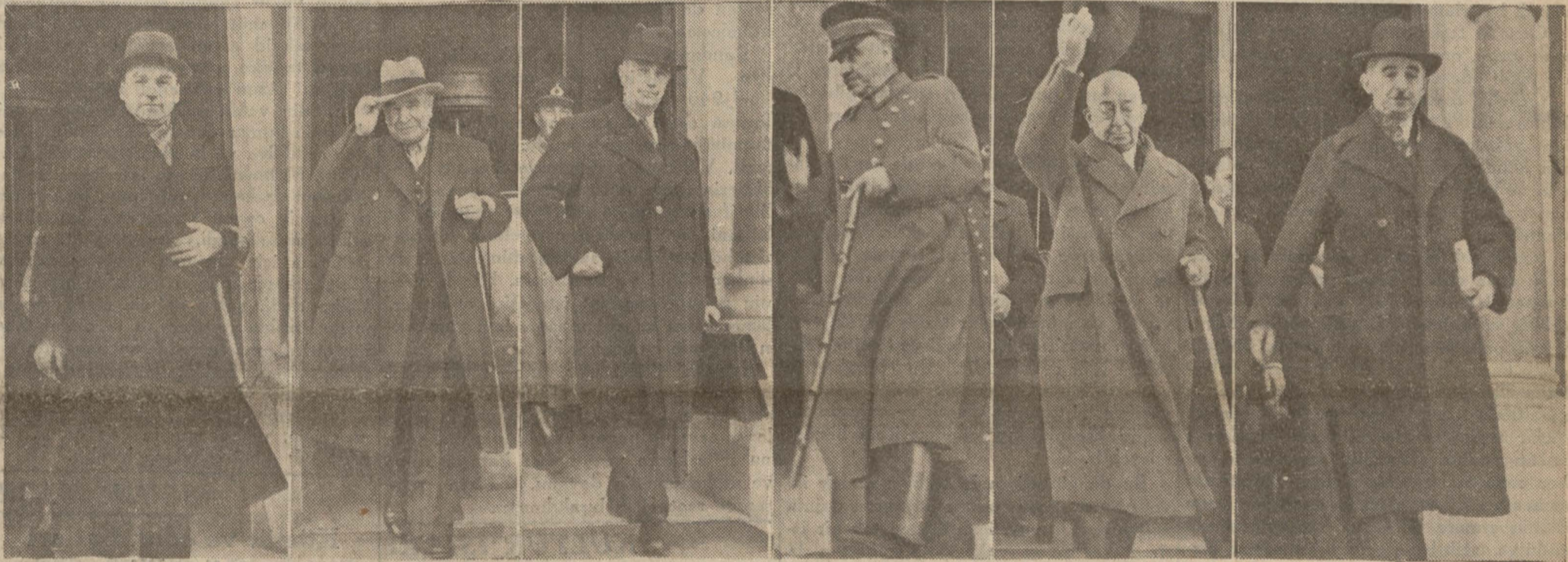
Millî Şefimiz İnönü ve onu takiben Başvekil, Mareşal, Millî Müdafaa, Münakale ve Dahiliye Vekilleri, Yüksek Millî Müdafaa Meclisinden ayrılırken