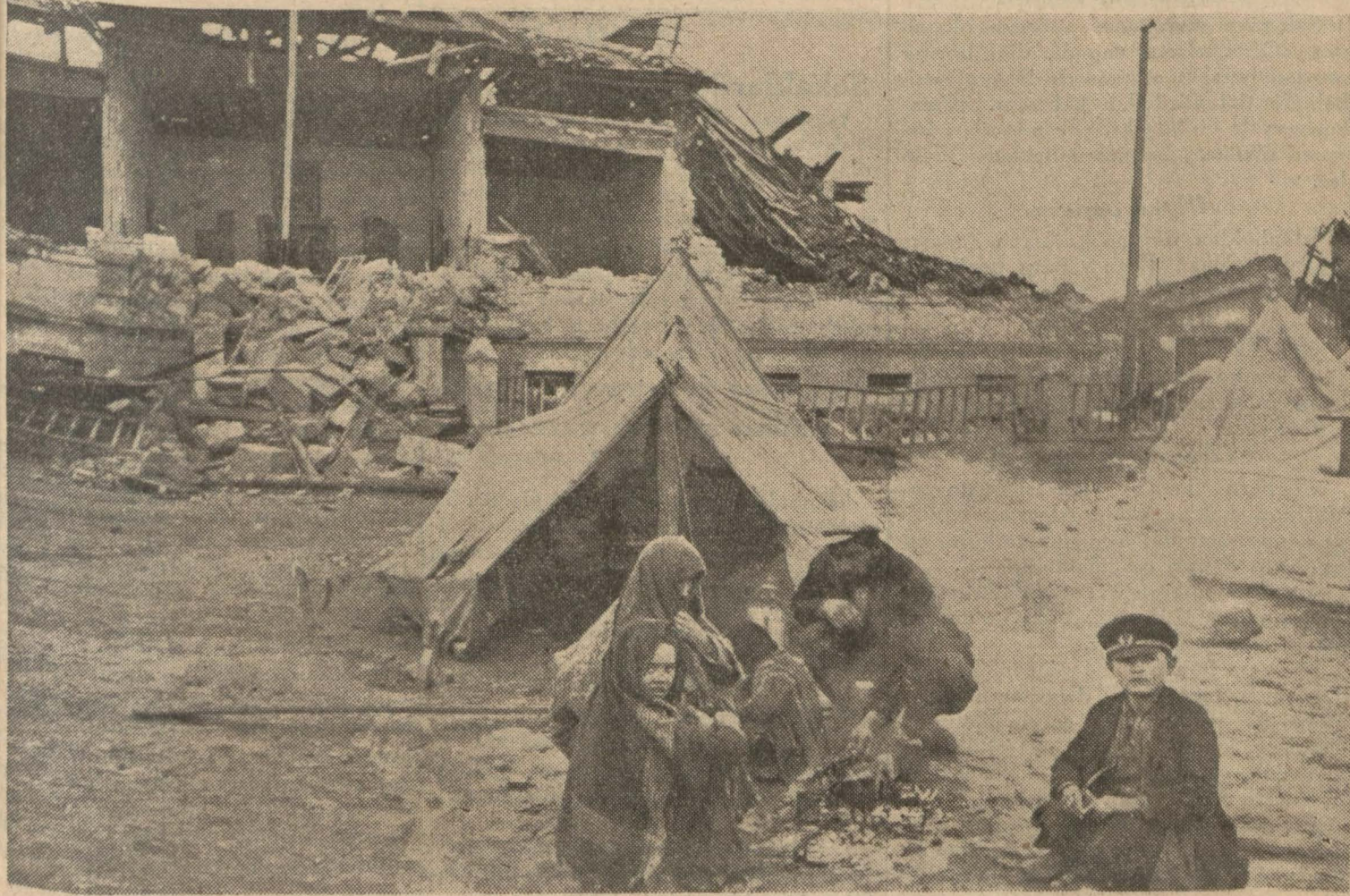
Erzincanda kurdukları çadırın önünde yardım bekleyen bir aile

Mağkûmiyetlerin hangi mıntakalarda tecil olunacağı yakında tayin edilecek