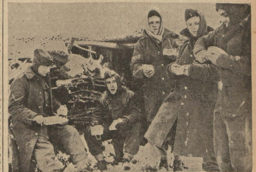
Garb cephesinde kar üstünde gay işen İngiliz askerleri

Şimal denizinde de bazı gemiler bombardıman edildi. Almanların topla mücehhez yeni tip tayyarelerinin esrarı öğrenildi