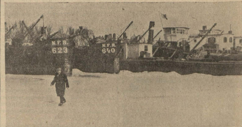
Tuna nehrinin donmuş bir hali...

Tuna nehri dondu, Avrupanın her tarafında çok şiddetli soğuklar hüküm sürmektedir