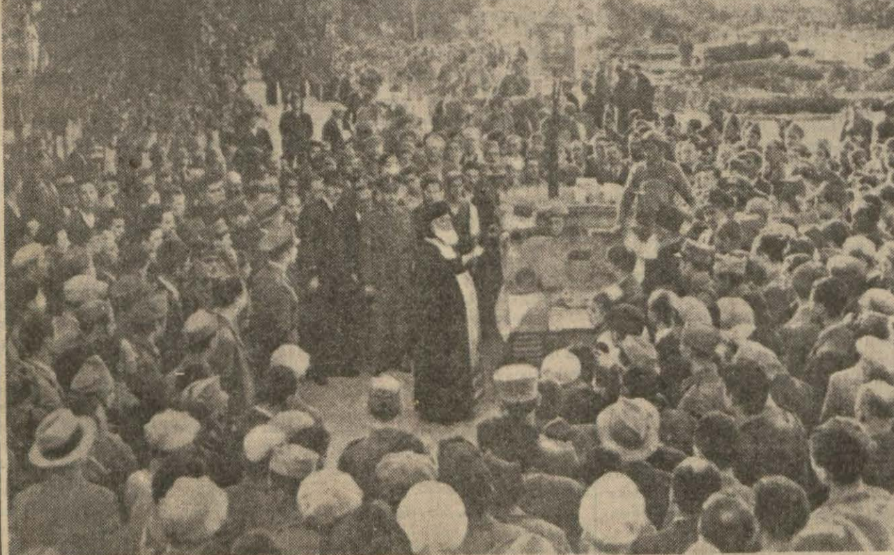
Girid adasına ihrac olunan İngiliz kıt'alarından motorize birlikler dini âyinlerle istikbal olunuyor