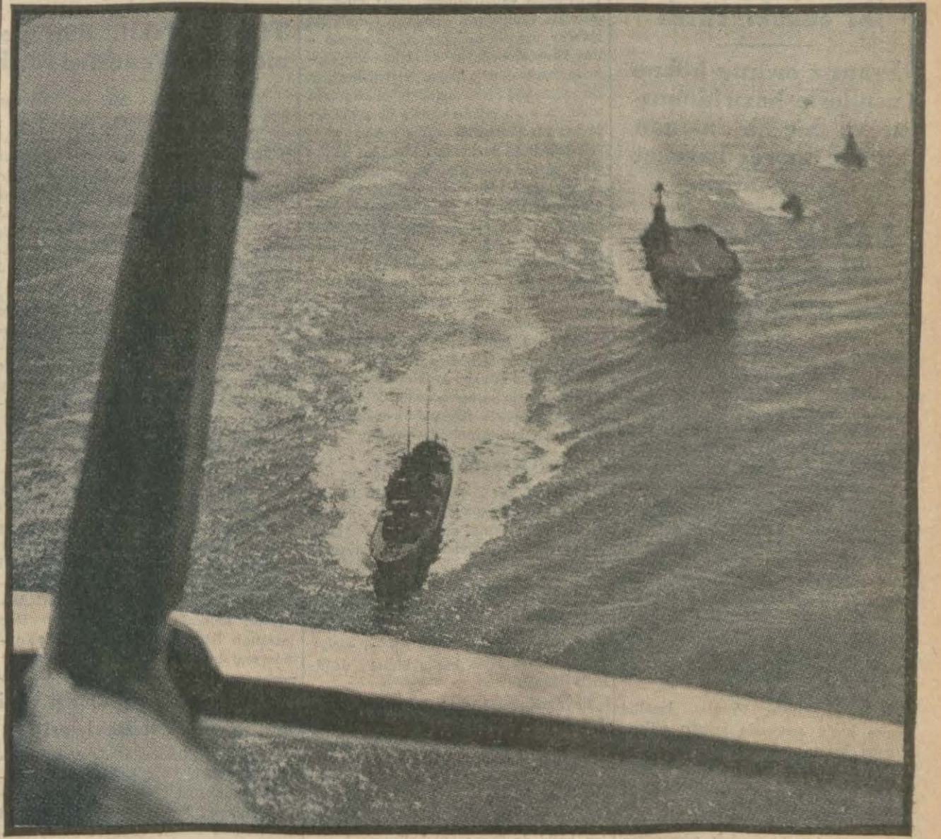
İtalyan limanlarile Akdenizdeki deniz harblerinde bombardıman tayareleriyle büyük rol oynayan İngilizlerin Arc Royal tayarre gemisi, filo refakatinde süratle seyrederken