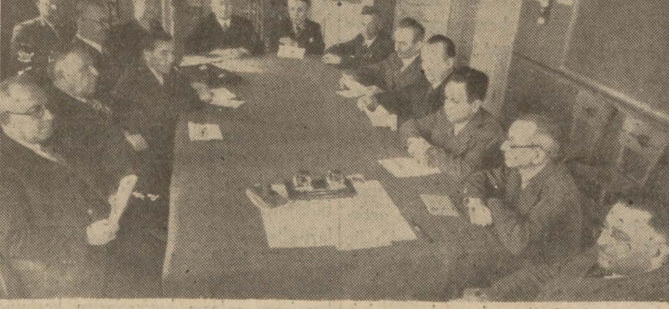
Beyoğlu Akşam Kız Sar'at mektebinde lise ve orta mekteb müdürlerinin dünkü son içtımandan bir görünüş

İlk tedrisat işleri etrafında ileri sürülecek teklifler, bugün kat'î şeklini alacak