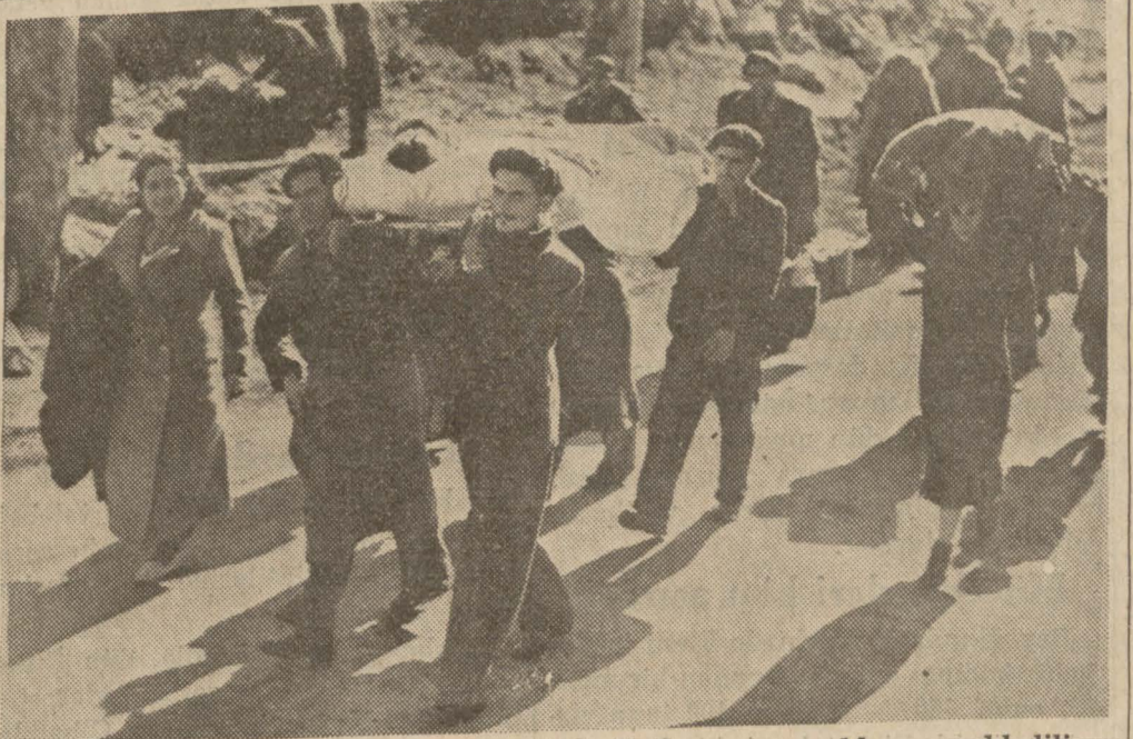
Bir İspanyol yaralı mültecilerin omuzlarında Fransız topraklarına naklediliyor

Bu rol, devletin yüksek menfaatlerine mutabık olarak hükümetle hemahenk yürümeği istiyen yolda tahakkuk eder. Haricî siyaset, ad mevzuu değildir. Bu mevzuda imetle hemahenk yürümek, memleketle ve milletin hakimiyetile hemahenk bulunmak da demektir. Milletlerin adına mazhar hükümetler, ekser akti diplomatik dehlizlerinde saklı kalan haricî siyasette vukuf ve salâhiyetle yürüvâsını haiz yegâne heyetlerdir. Bu haricî hatalara düşmemek için hakikat-hükümetlerden öğrenmeğe ve herhalatların yürüdüğü yolda yürümeğe kat'î ihtiyac vardır.