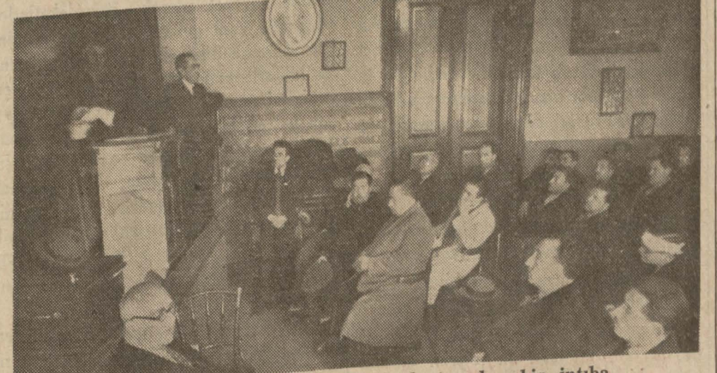
Kasablar Cemiyetinin dünkü toplantısından bir intiba (Yazısı 7. nci sahifemizde)

Cemiyetin dünkü toplantısında sakatçıların idare heyeti intihabına iştirak ettirilmemesi hakkındaki teklifler, uzun münakaşalara sebep oldu