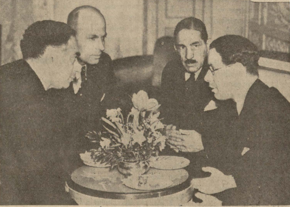
Londra konferansında, İngiliz Müstemlekât Nazırı (sağda) Irak, Süveyş Arabistan ve Mısır murahhaslarile görüşüyor

Çemberlayn, aradaki suitefehhümlerin izale için 1915 te teati edilen mektubları beyan kitab halinde neşrettirecek