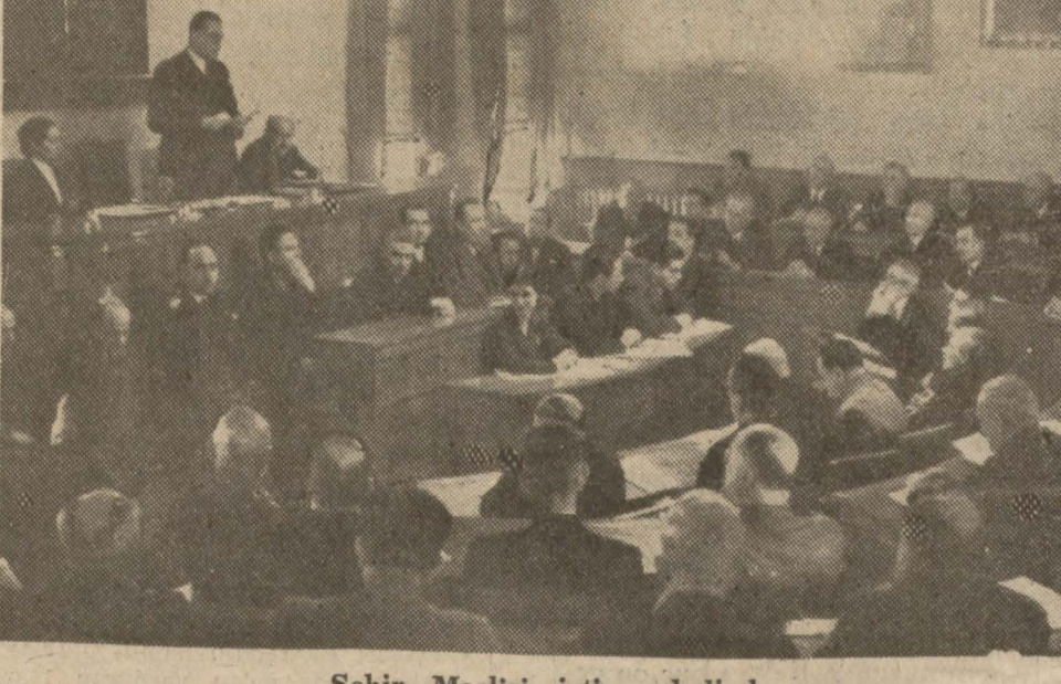
Şehir Meclisi içtımada halinde (Yazısı 7. nci sahifemizde)

Burada mevcut bir kısım tarihî taşların muhafaza edilerek bir yerde toplanması takarür et