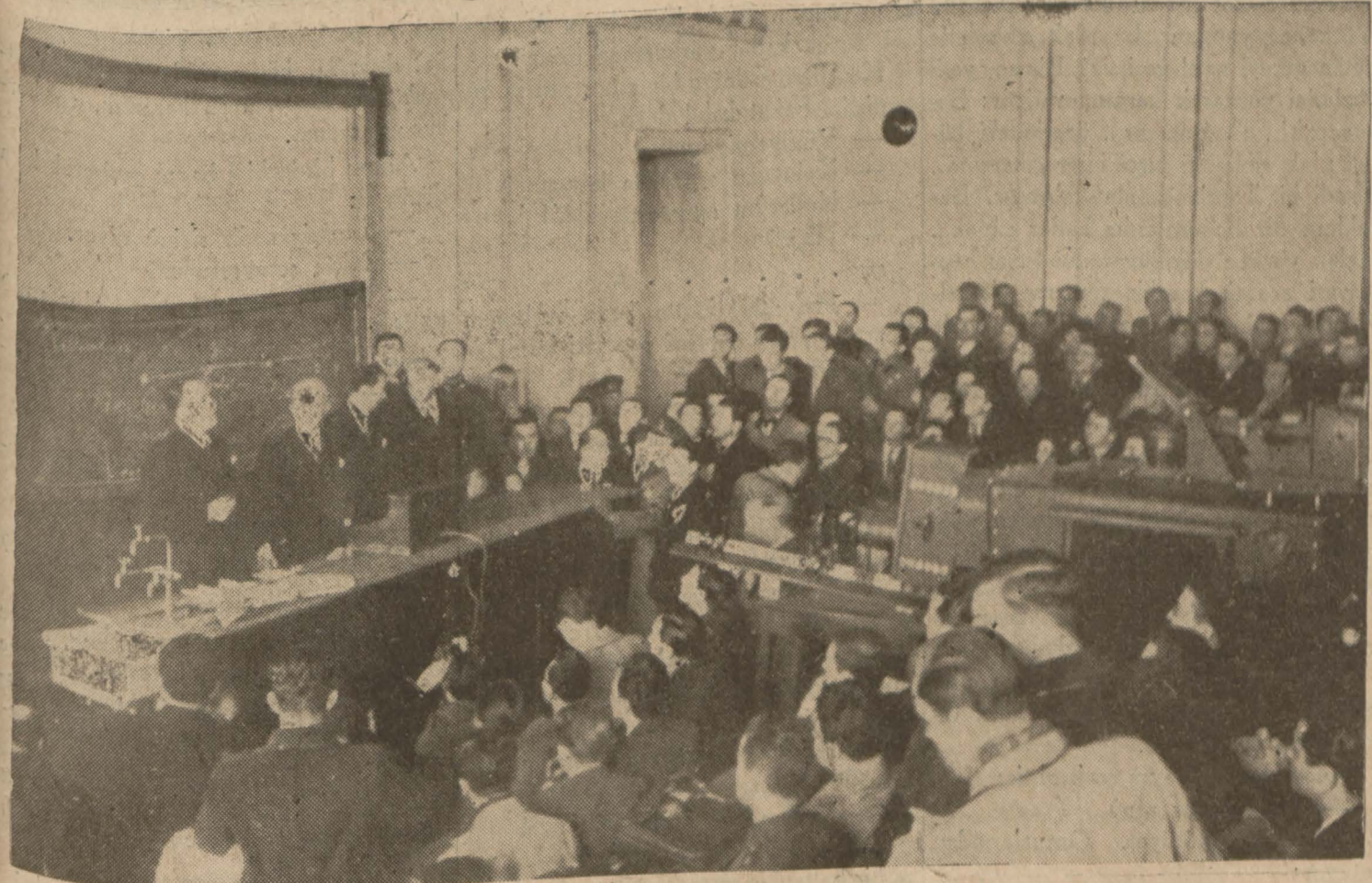
Şef, sınıflardan birinde verilen dersi takib ediyor