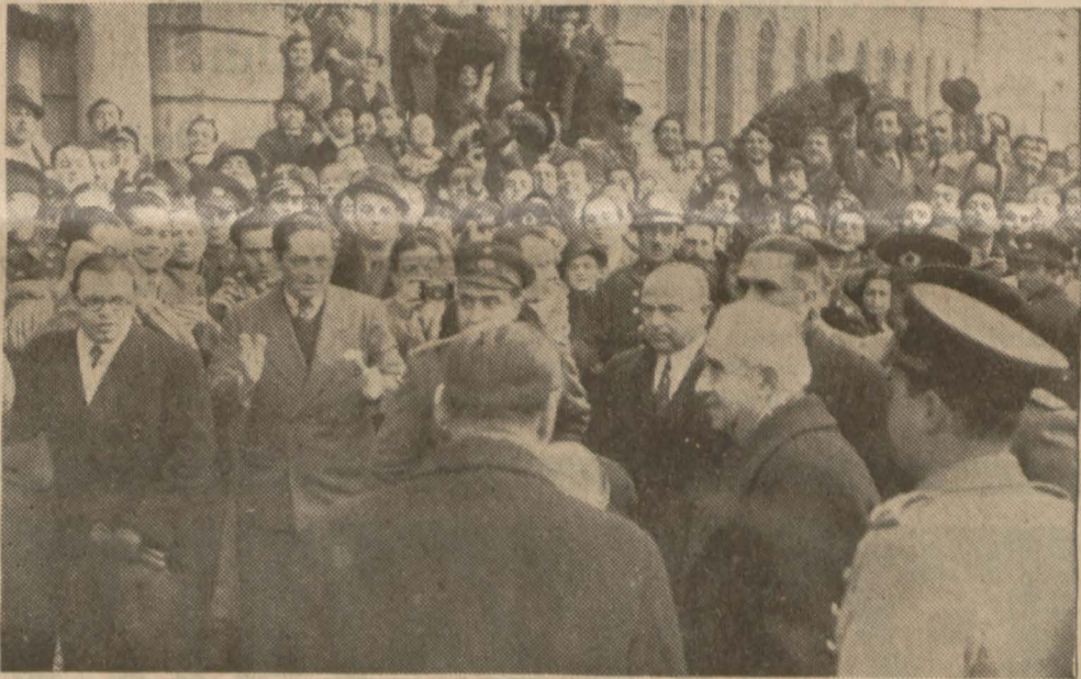
Millî Şefin Üniversite binasına girişinden bir intiba