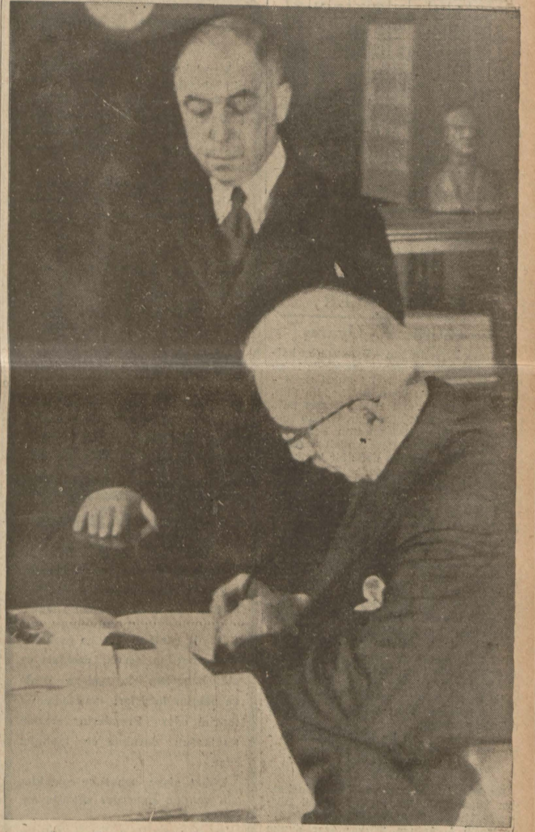
İsmet İnönü, Rektörlük odasındaki meşguliyetleri sırasında