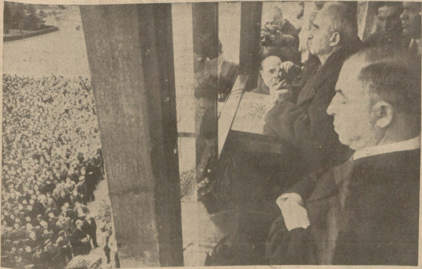
Cumhur Reismiz, dünkü büyük nutkunu irad ediyor