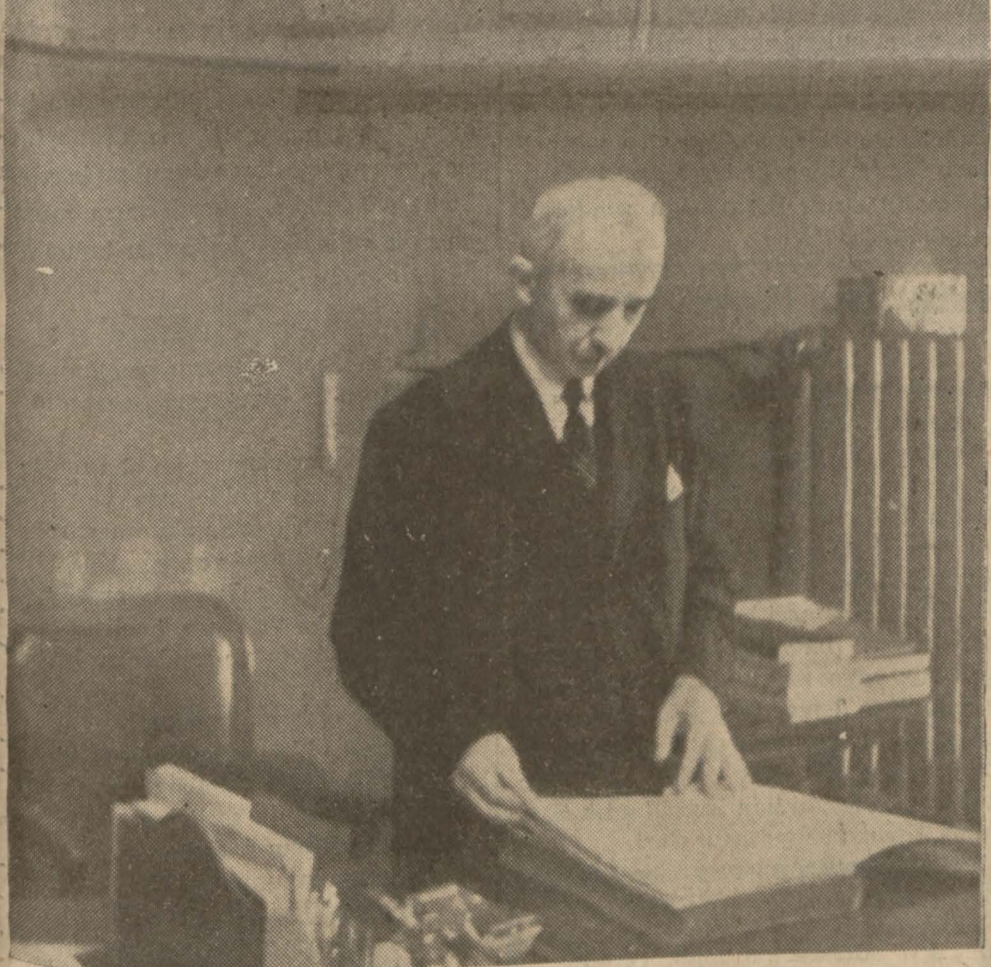
Millî Şef, Üniversitenin hatıra defterini gözden geçiriyor