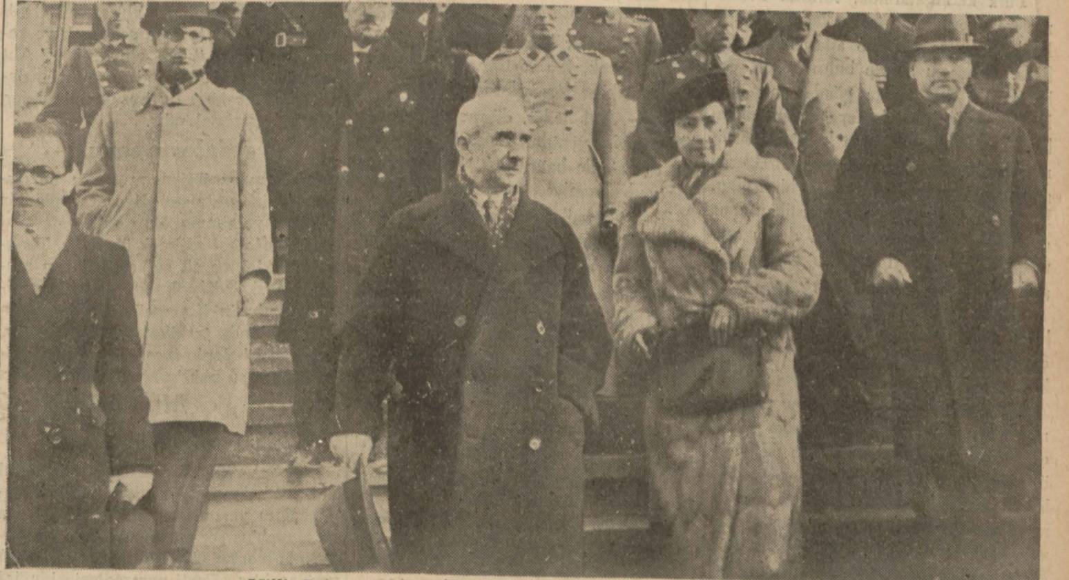
Millî Şef ve Bayan İnönü Çatalca'da Orduvinden çıkıyorlar