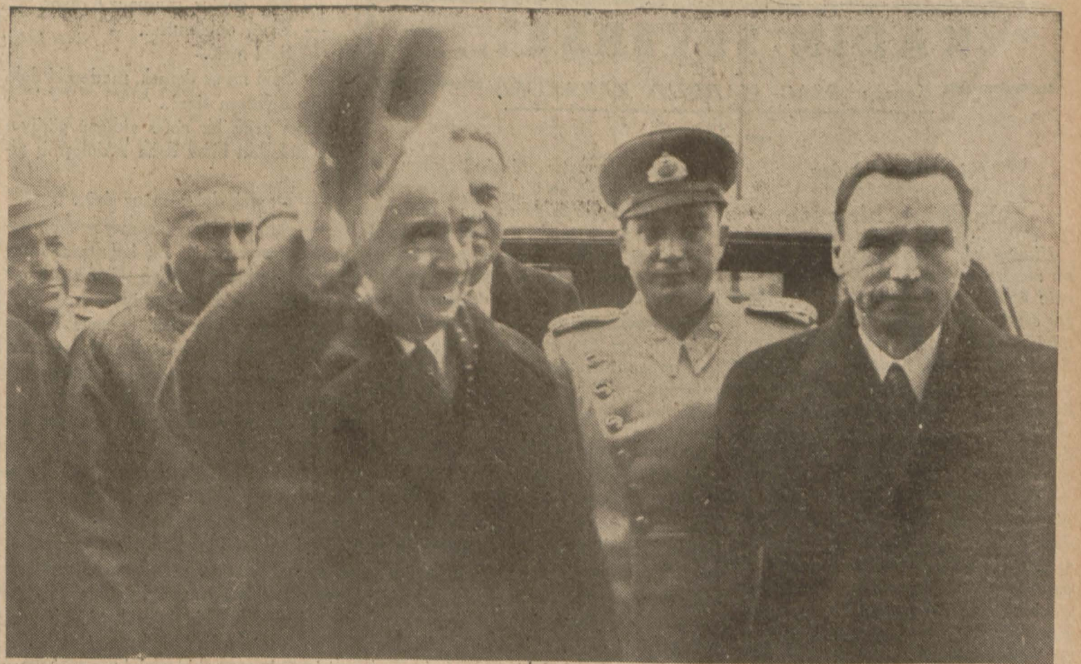
Millî Şefin Üniversiteye gelişi