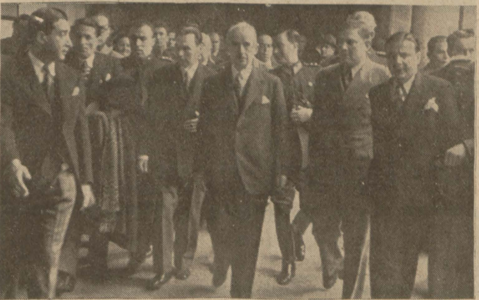
Şef, Üniversite koridorlarında