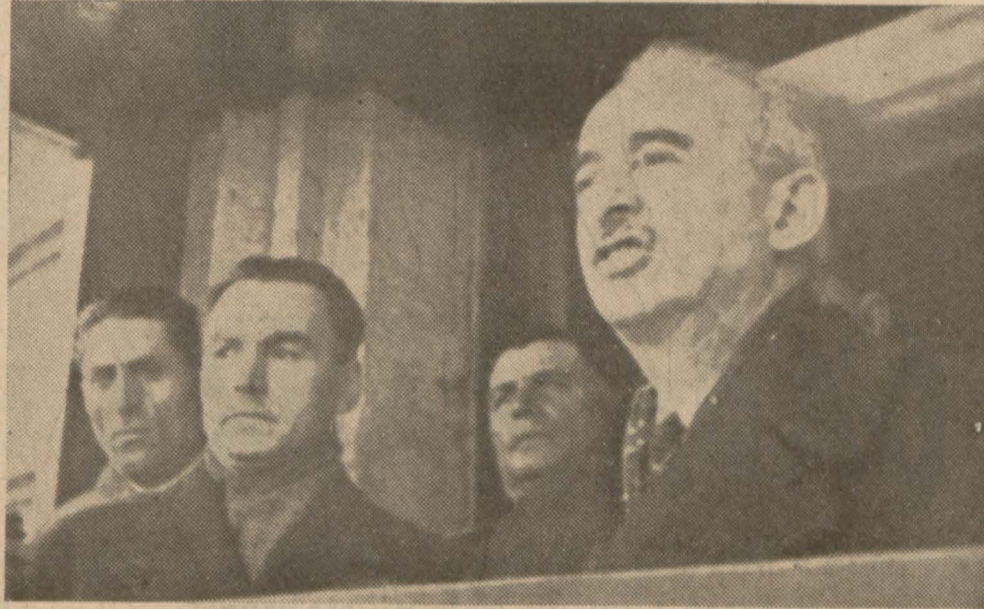
İsmet İnönünün nutkunu irad ederken bir başka poz