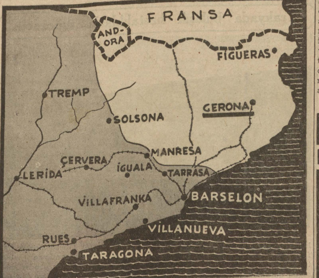
İspanyada, Barselonun zaptından sonraki vaziyeti gösterir harta (Yazısı 7 nci sahifemizde)

Franko kuvvetleri Katalonyada yayılmaya devam ediyor. Dün bir bombardımanda sekiz yüz elli gönüllü öldü