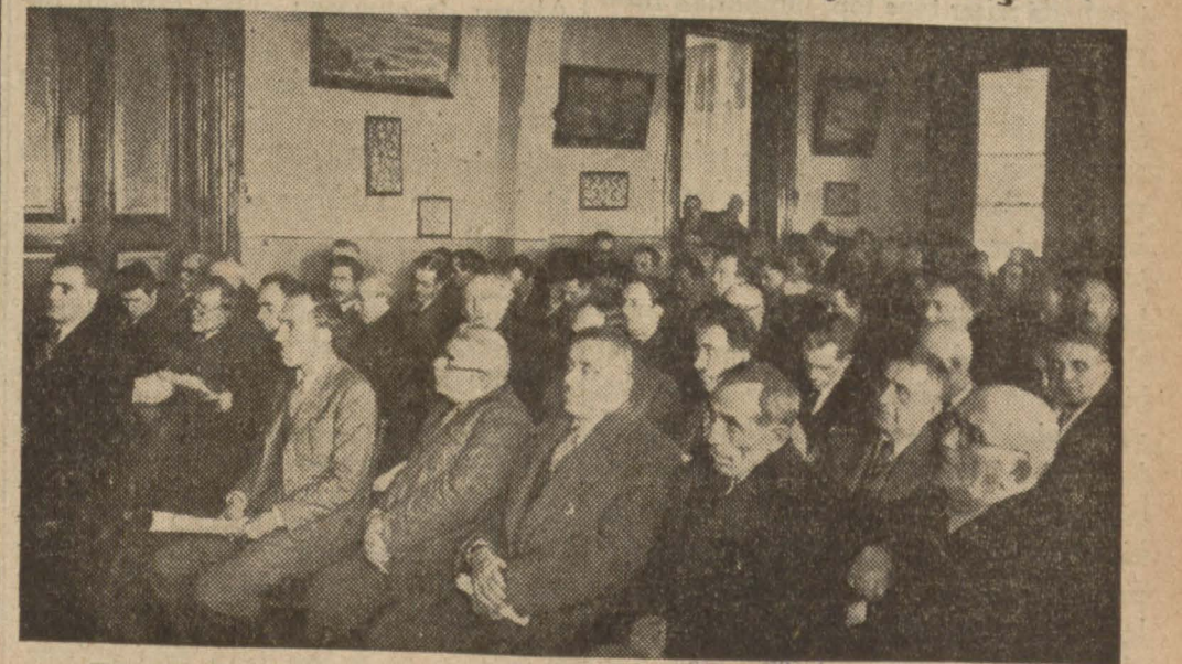
Dünkü Esnaf Cemiyetleri toplantısında bulunanlardan bir grup (Yazısı 8 inci sahifemizde)

Dünkü toplantıda Esnaf Hastanesinin vaziyeti tetkik edildi ve yeni idare heyeti seçildi