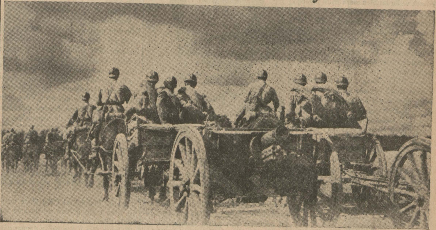
Harekât sahasında ilerlemekte olan Sovyet topçu kıt'alarından bir grup

Şiddetli bombardıman neticesinde Varşova bir harabe haline geldi, şehre mütemadiyen yangın bombaları atılıyor