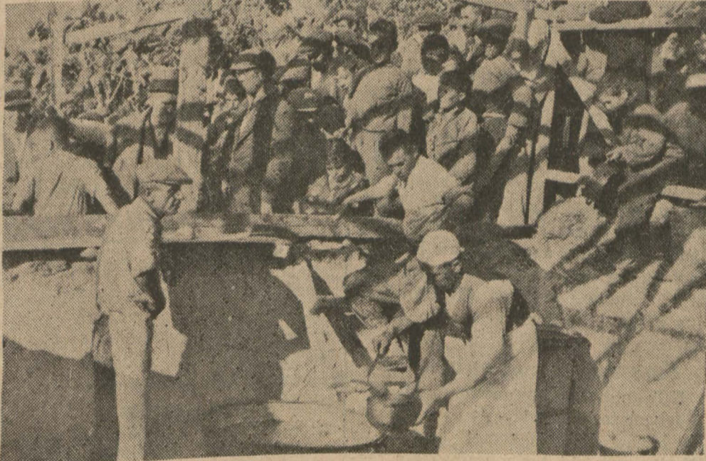
Felâketzedelere sıcak yemek ve çorba dağıtılıyor

İzmir 26 (Telefonla) — Zelzelemin gittikçe genişleyen bir korkunun doğmasına sebep olmuştur; yağmurların da inşimamı üzerine bilhassa zelzele mntakasında çok seri tedbirleri icab ettirecek bir vaziyet tevild etmektedir. Çandarlı da harab oldu Bu gece Çandarlı nahiyesinde de şiddetli bir zelzele olmuş, gece vakti halk evlerinden sokaklara fırlamıştır. Dikili kaymakamı, hükümet tabibi Çandarlıya