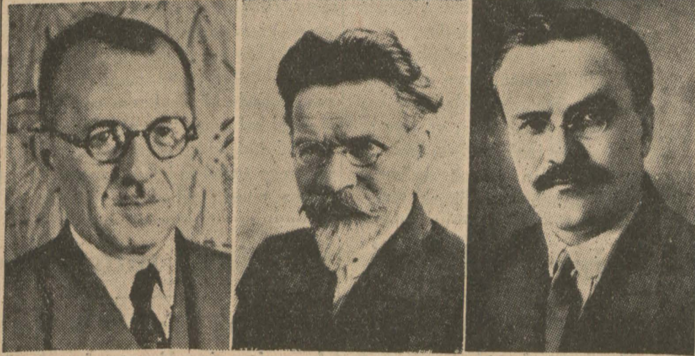
Sükrü Saracoğlu Kalenin Molotof

Moskova 26 (a.a.) — Türkiye Hariciye Vekili Sükrü Saracoğlu bu sabah Kremlin sarayında Molotof ve Kalenin ile görüşmüştür. Vekil, öğle yemeğini Kremlin'de bu zevatla birlikte yiyecektir. Hariciye Vekilimiz Stalin tarafından kabul edildi Moskova 26 (Hususi) — Türkiye Hariciye Vekili Sükrü Saracoğlu şerefine Kremlin sarayında resmî bir ziyafet verilmiştir. Misafir Vekil, ziyafetten sonra Stalin tarafından kabul edilmiştir.