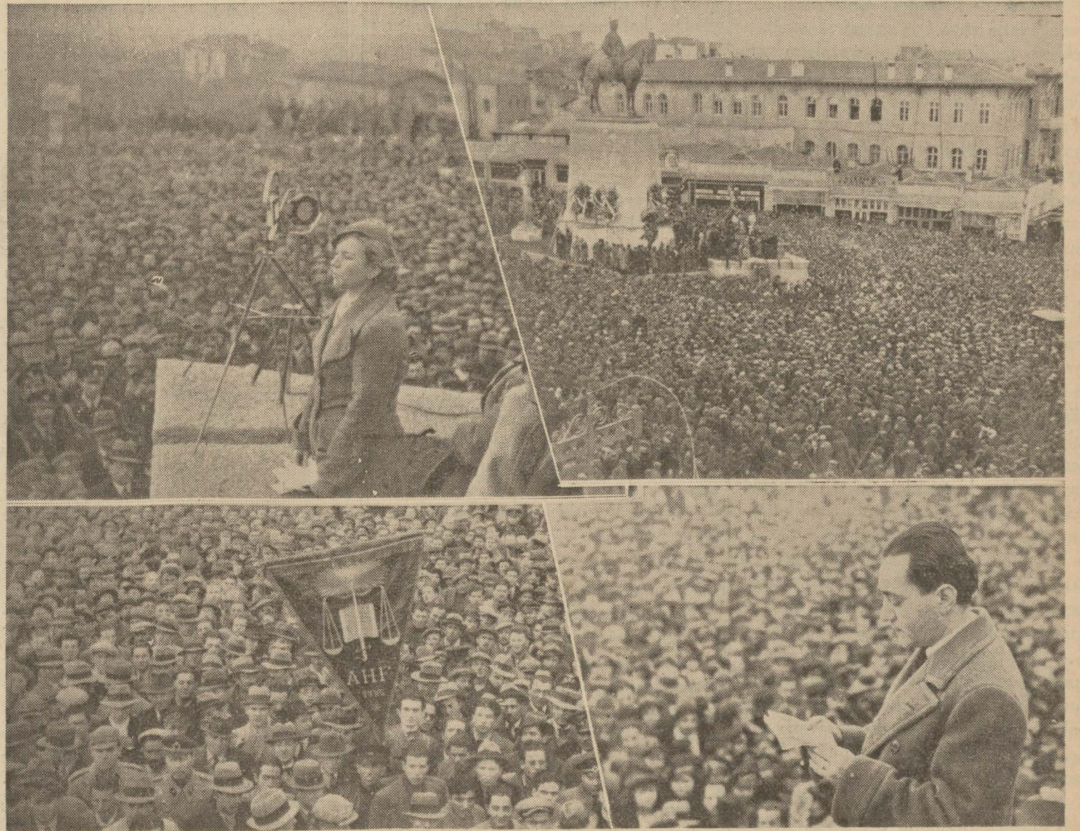
Evvelki gün Ankarada da, Hatay zaferi için büyük bir miting yapıldığını yazmıştı. Yukarıki resimler bu muazzam tezahürattan birkaç intibadır: