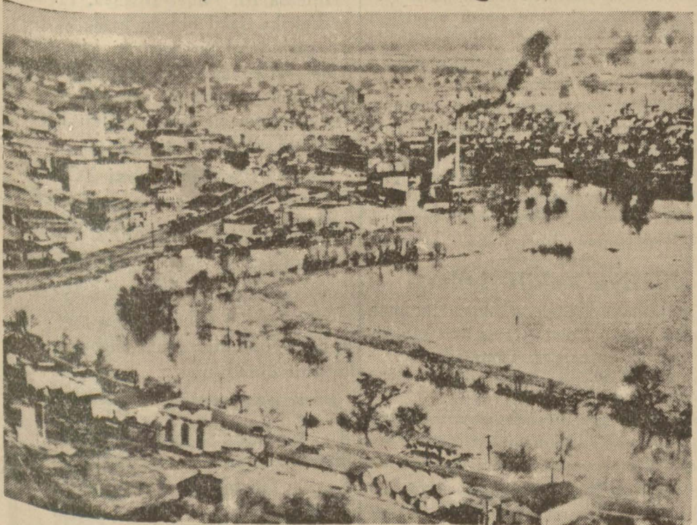
Amerikada suların bastığı muntakada bir kasaba