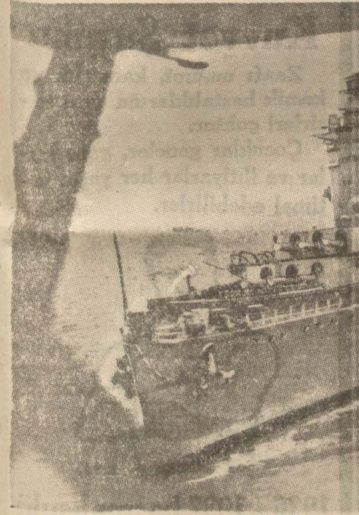
İngiliz Anavatan filosu açık denize çıkarken

13 denizaltı: Beheri 1080 ilâ 2900 ton olmak üzere muhtelif cesamette.