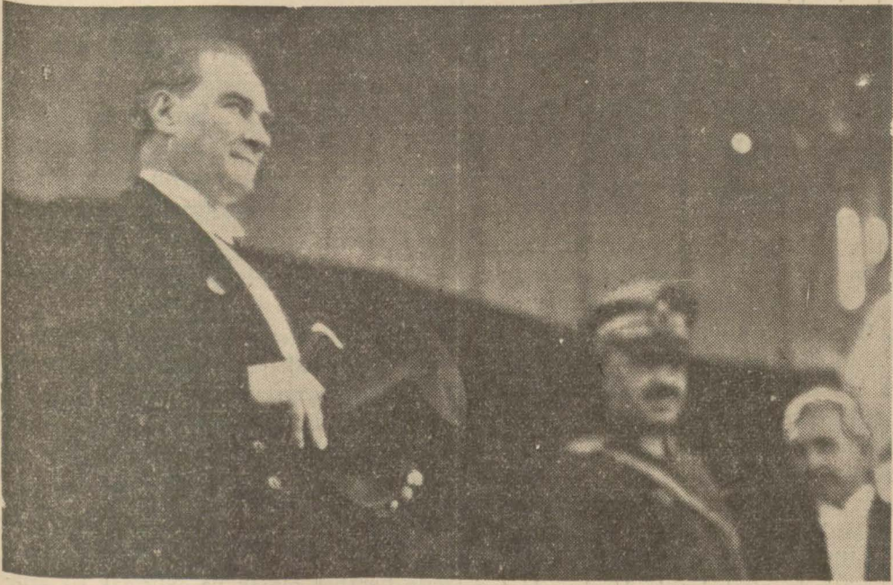
Ulu Önder, Başbuğu olduğu ordunun ve gençliğin geçid resmini derin bir itminan içinde temaşa ediyorlar

«Atatürk yalnız memleket ölçüsile değil, dünya, medeniyet ve tarih ölçüsile Büyük Adamdır»