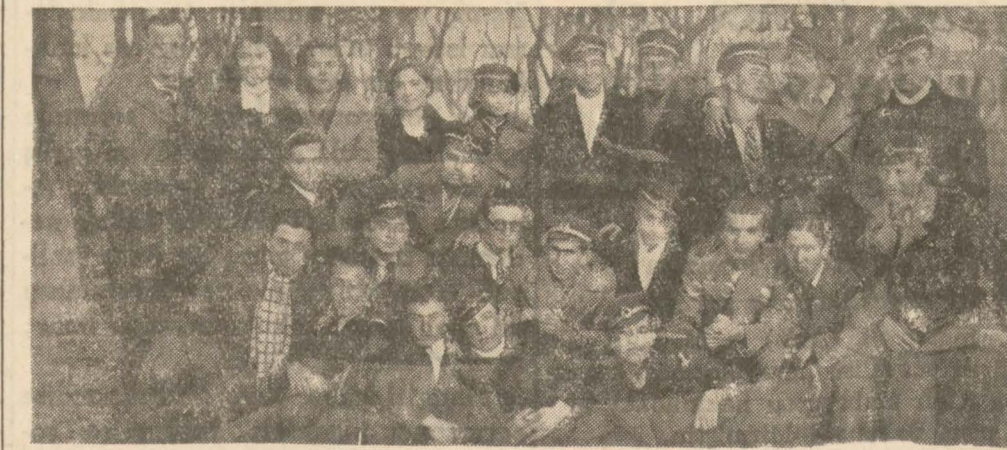
Liseden çıkarılan talebeler ceza gören diğer arkadaşlarıyla beraber

Bir hiç yüzünden çıkan hâdise üzerine mektebden kovulan talebeler sokaklarda dolaşiyor ve Vekâletin vereceği kararı bekliyorlar