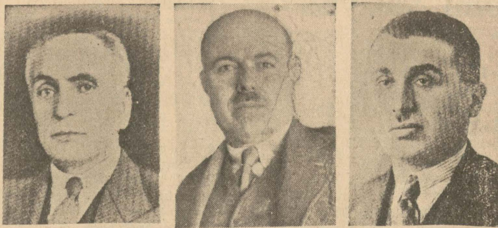
Orman kanununun birinci müzakeresinde söz söyleyen meb'uslar

Bu münasebetle Mecliste münakaşalar oldu, bazı taktirler verildi, fakat maddeler aynen kabul olundu