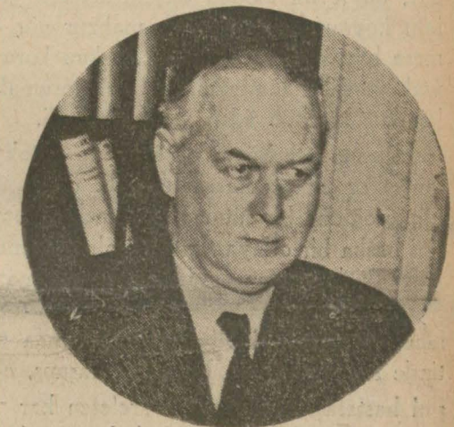
İngiltere Müdafaa Komitesi reisi Sir Juskipt

heyecan ayandırdı Londra 4 (A.A.) — Büyük faşist