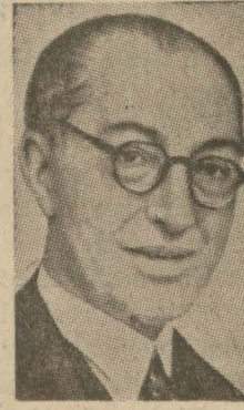
Dr. Rüştü Aras

Paris 4 (A.A.) — Övr gazetesini pek yakında Türkiye, Irak, İran ve Efganistan arasında bir Asya paktnın akdedileceğini bildiriyor. Türkiye Dış Bakanı Dr. Rüştü Aras birkaç gün içinde Bağdad'a ve Tahrana giderek orada Efganistan Dış Bakanına malûk olacak. Paktnın bir seyahat esnasında parafe ve Ankarada imza edileceği bildirilmektedir.