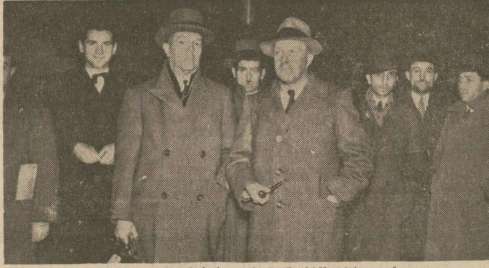
Dün Hataydan şehrimize gelen müşahidler istasyonda

Bir gün İstanbulda kaldıktan sonra yarı akşamki ekspresle doğru Cenevreye [Arkası Sa. 4 sütun 4 te]