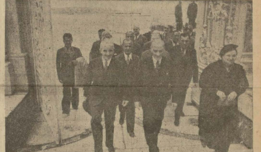
Atatürk, hemşireleri ve Başvekilile beraber saraya girerken

Hususi tren, saat tam on ikiyi yirmi geçe gara girmiştir. Büyük Şef, kompartmanlarından inerek kendilerini karşıla- mağa gelenlerin ellerini sıkarak suretlice iltifatta bulunmuşlar ve İsmet İnönü ile Bayan Makbuleyi ve Dahiliye, Maarif Vekillerini refakatlerine alarak, Haydar-