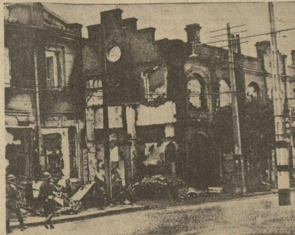
Şanghayda hava bombardmanile yıkılan binalar (Yazısı 3 üncü sahifemizdedir)

Mahsur Çin ordusu, çemberi kıramadı. Bir Çin generali esir düştü. Çinliler 5000 maktül ve yaralı verdiler. Ecnebi diplomatlar Nankinden çıkıyorlar