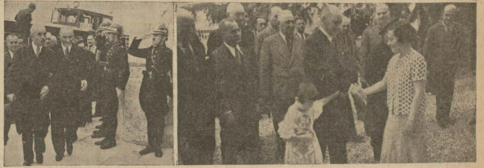
Yukarıda, Atatürkün Haydarpaşada istikbali, aşağıda Büyük Şef Başvekilile beraber kolkola Saraya giriyor, sağda kadın tayyarecimiz Sabiha Gökçen Sarayın bahçesinde Atatürkü karşılarlarken

Nyon anlaşmasının Büyük Millet Meclisinde müzakere ve tasdiki münasebetile Ankarayı teşrif eden Atatürk, refakatlerinde Başvekil İsmet İnönü ve bazı Vekiller olduğu halde, dün hususi trenlerle şehrimize dönmüşlerdir.