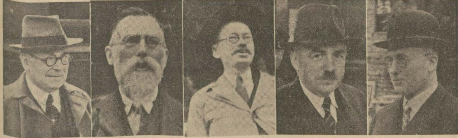
Tarih Kurultayı için şehrimize gelen Alman, Avusturya, Fransız, İngiliz, İsveç profesörleri