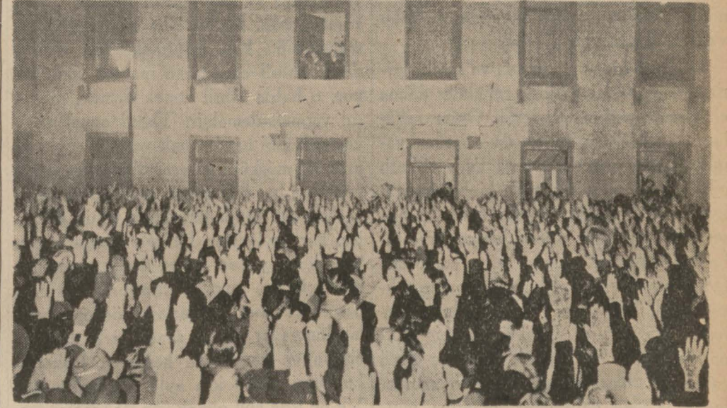
Hitler Başvekilât binasının penceresinde halkı selâmlarken Fransanın alacağı hattı hareketi tayin edecek. Bu toplantıdan sonra Fransa, İngiltere, Belçika ve İtalyan hükümetlerini bir konferansa davet edilecektir. Siyasî me-

Birinci madde cemiyeti şöyle tarif ediyor: (Arkası 6 ncı sahifede)