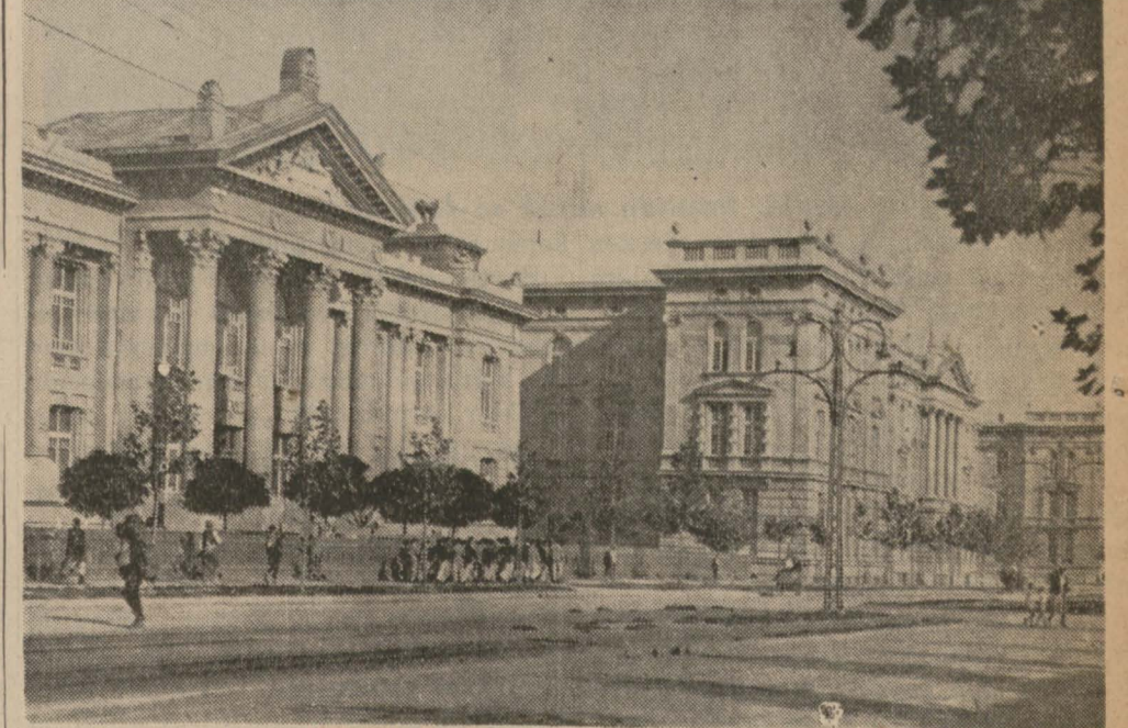
Belgradtan bir manzara

Yunan gazeteleri Belgrad toplantısında paktın askerî cephesinin müzakere edileceğini vazıyorlar