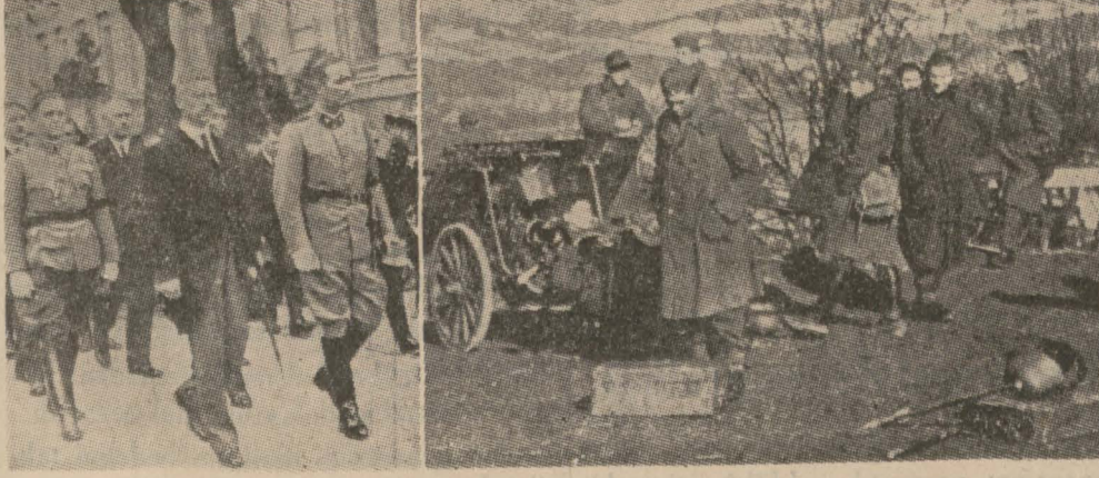
Resmî Avusturya ordusundan bir topçu müzrezile Başvekil ve muavini bir arada

Bunlardan Prens Ştarhemberge bağlı olan Heinvehren teşkilâtına İtalya ayda 2 milyon lîret vermekte ve Museviler yardım etmektedir